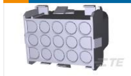
TE 产品编号1-480711-0 15P UMNL CAP HSG NATL