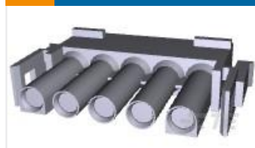
TE 产品编号926299-3 5P UN-MNL STECKGEH