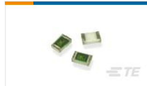
TE 产品编号1676473-2 RN 0805 9K31 0.1% 10PPM 1KRL