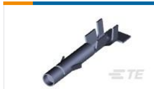
TE 产品编号926882-1 UMNL SOK 20-14 PTPBR