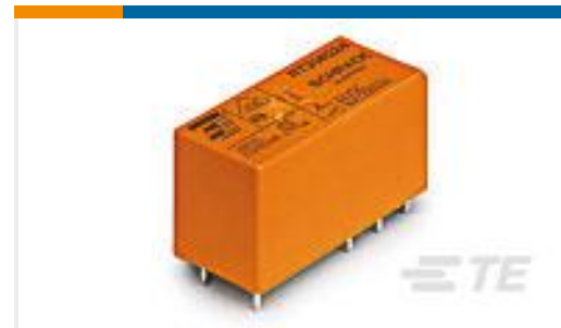
TE 产品编号1-1649328-3 RT314012