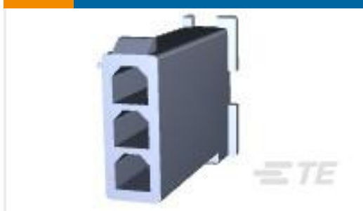
TE 产品编号172344-1 MINI UNIVERSAL MATE-N-LOK CAP HOUSING 3P