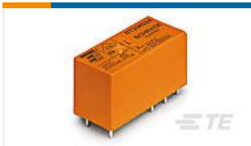
TE 产品编号6-1393238-8 RTD14024