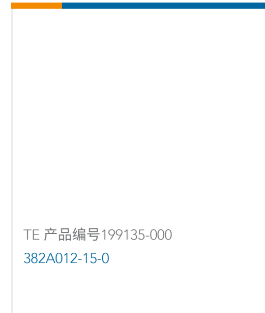
TE 产品编号199135-000 382A012-15-0