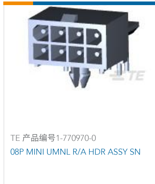
TE 产品编号1-770970-0 08P MINI UMNL R/A HDR ASSY SN