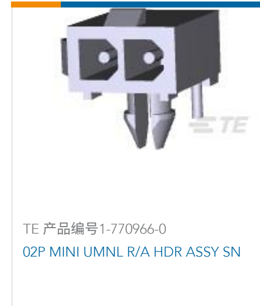
TE 产品编号1-770966-0 02P MINI UMNL R/A HDR ASSY SN