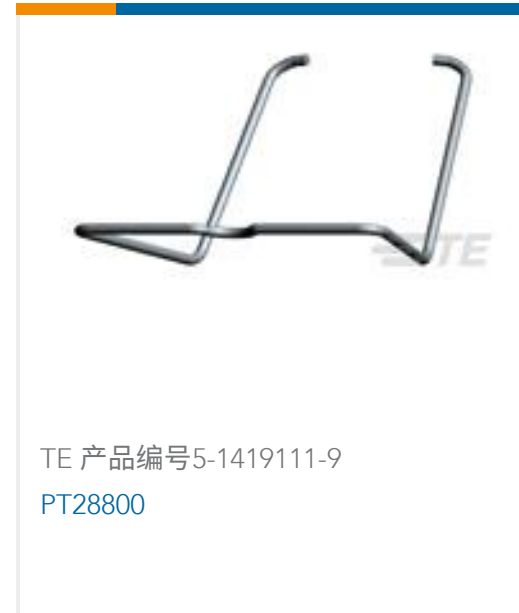
TE 产品编号5-1419111-9 PT28800