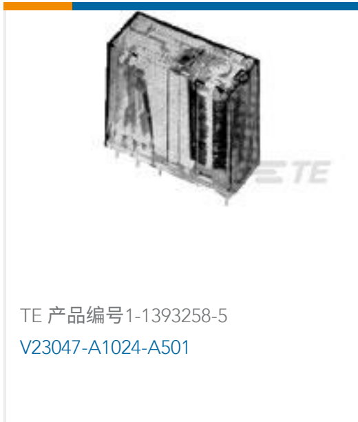
TE 产品编号1-1393258-5 V23047-A1024-A501