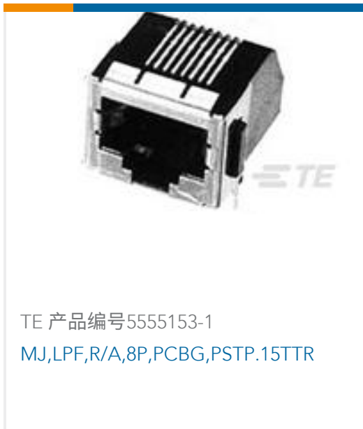
TE 产品编号5555153-1 MJ,LPF,R/A,8P,PCBG,PSTP.15TTR