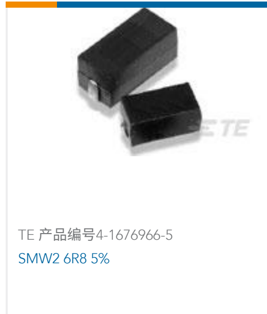
TE 产品编号4-1676966-5 SMW2 6R8 5%