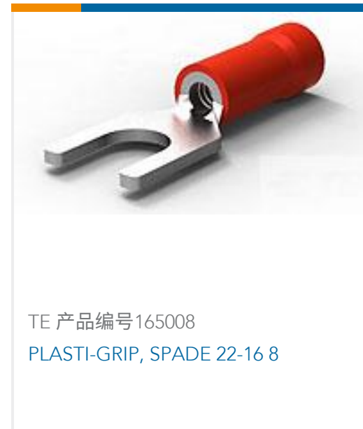
TE 产品编号165008 PLASTI-GRIP, SPADE 22-16 8