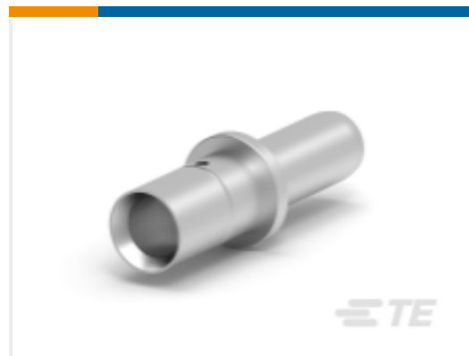
TE 产品编号SRK-PC-080-25-601 PIN, SOLID, SIZE M8, 25mm2, AG