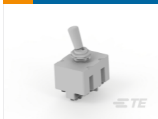
TE 产品编号K1002956 Toggle Switch 08-4-1-13