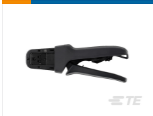
TE 产品编号DTT-20-03 CRIMP TOOL