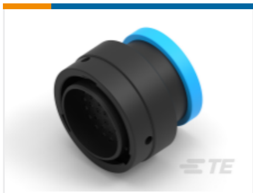
TE 产品编号YHDP26-24-35PEL017 PLG, 35P, BLK, E, RNG, 16/20, P