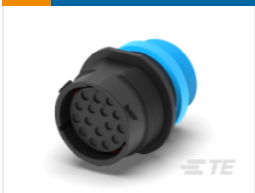
TE 产品编号HDP24-24-16SE-L015 REC, 16P, BLK, E, THD, 12, S