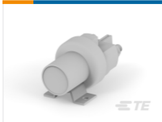
TE 产品编号K1008699 Relay 26-60-05