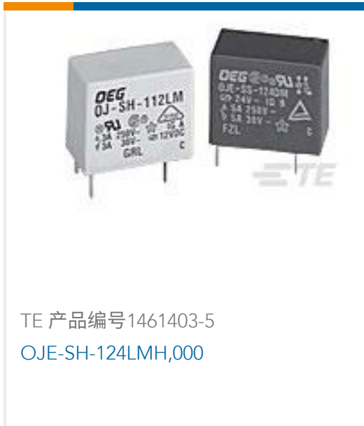
TE 产品编号1461403-5 OJE-SH-124LMH,000