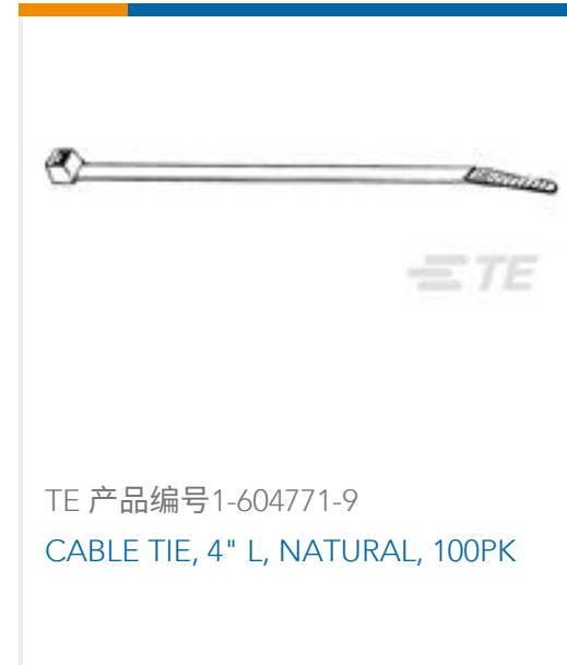
TE 产品编号1-604771-9 CABLE TIE, 4" L, NATURAL, 100PK