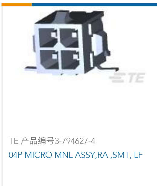
TE 产品编号3-794627-4 04P MICRO MNL ASSY,RA ,SMT, LF