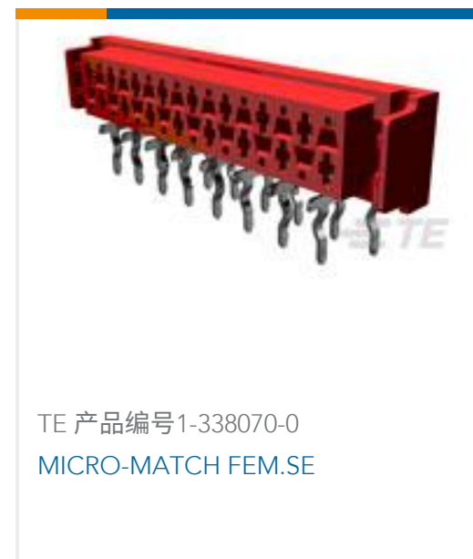
TE 产品编号1-338070-0 MICRO-MATCH FEM.SE