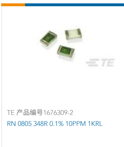
TE 产品编号1676309-2 RN 0805 348R 0.1% 10PPM 1KRL