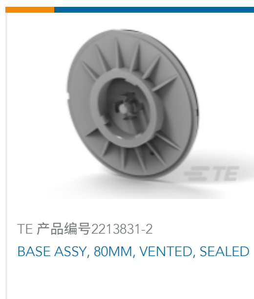
TE 产品编号2213831-2 BASE ASSY, 80MM, VENTED, SEALED