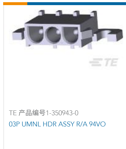
TE 产品编号1-350943-0 03P UMNL HDR ASSY R/A 94VO