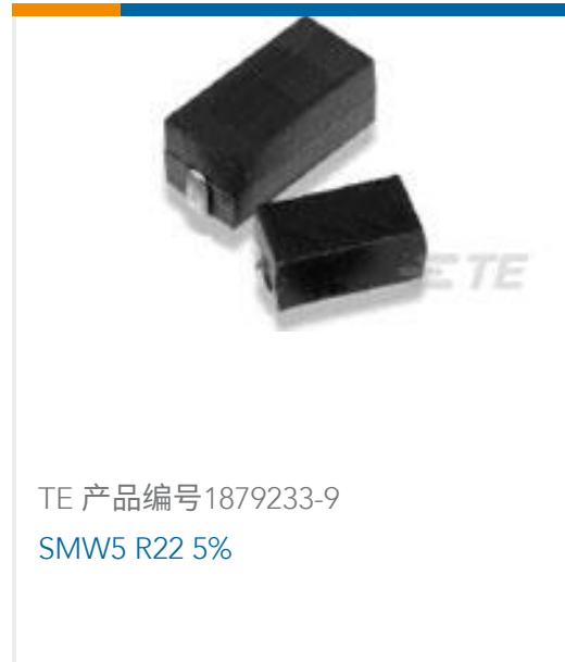
TE 产品编号1879233-9 SMW5 R22 5%