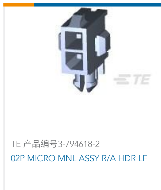
TE 产品编号3-794618-2 02P MICRO MNL ASSY R/A HDR LF