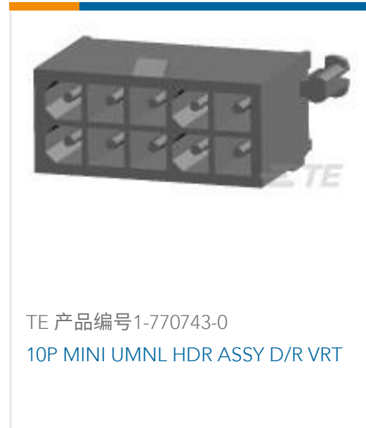
TE 产品编号1-770743-0 10P MINI UMNL HDR ASSY D/R VRT