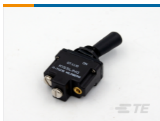
TE 产品编号K1007153 Toggle Switch 08-1-1-13