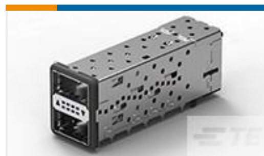
TE 产品编号2085945-3 QSFP+ Assy, 2x1, Gskt, 4LP-All, Sn EONs