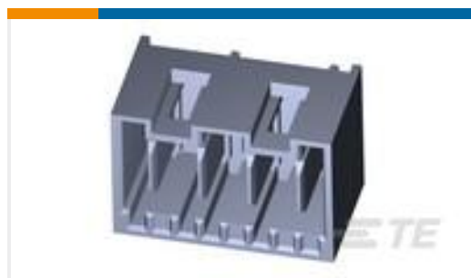
TE 产品编号1-1971895-4 4P, RAST 5 Tab Header, THV