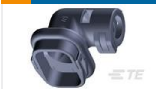
TE 产品编号1801467-2 COVER, FIXED, 3 WAY HP CONNECTOR