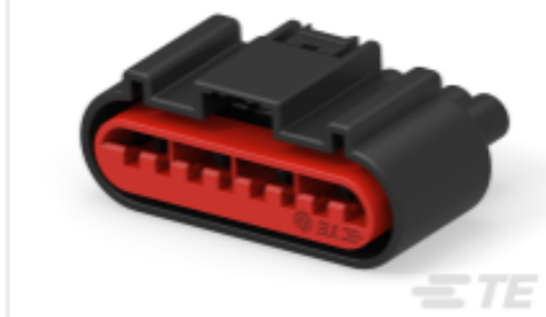
TE 产品编号1-2112058-2 8POS,YES 1.5,SOCK HSG,ASSY, SEALED