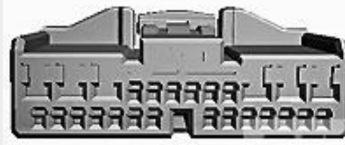
TE 产品编号1674932-1 0.64 III/2.3 II 26POS PLUG ASSY