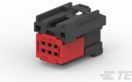
TE 产品编号9-1411325-5 2X3 POS GET-FEMALE CONNECTOR U