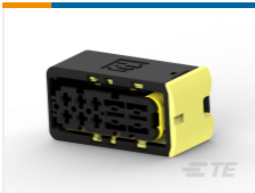
TE 产品编号1-2299782-1 8POS,MIXED,REC HSG,ASSY,SLD