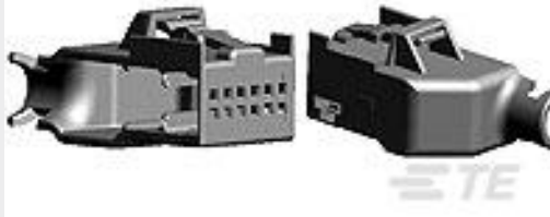
TE 产品编号1-1534096-1 MOS ABDECKKAPPE2X6P