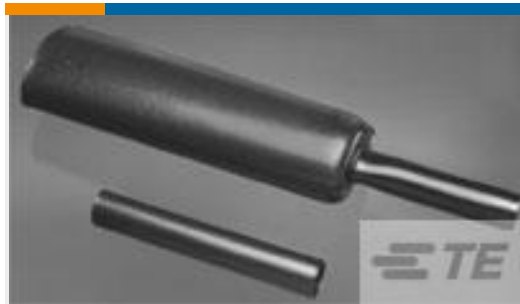
TE 产品编号F46631-000 RMW-160/50-1200/ADH-0