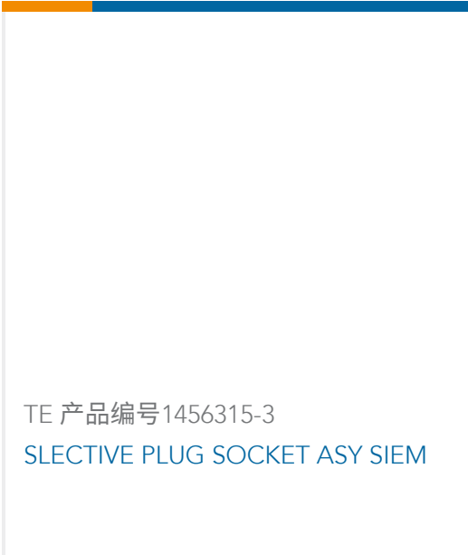
TE 产品编号1456315-3 SLECTIVE PLUG SOCKET ASY SIEM