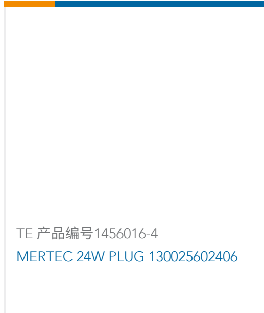
TE 产品编号1456016-4 MERTEC 24W PLUG 130025602406