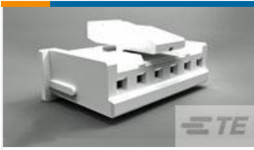
TE 产品编号1744417-5 5 POS EP 2.5 HSG, GLOW WIRE