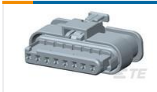
TE 产品编号1-1719393-1 8POS, MCON 1.2 LL REC SEALED