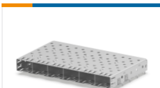
TE 产品编号 2007498-2 1X6 SFP PCI Cage Assembly