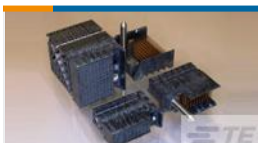
TE 产品编号 2007838-2 IMP100S,H,V4P16C,JG,DEW39,4.9