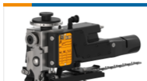
TE 产品编号 2150677-2 OCEAN_2.0_APPLICATOR-E-100F-REA