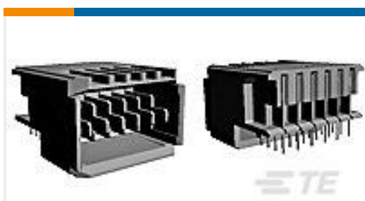
TE 产品编号 120974-1 UPM HEADER ASSY, LF