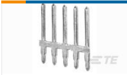
TE 产品编号3-87878-2 MOD II POST PLTD 50 AU