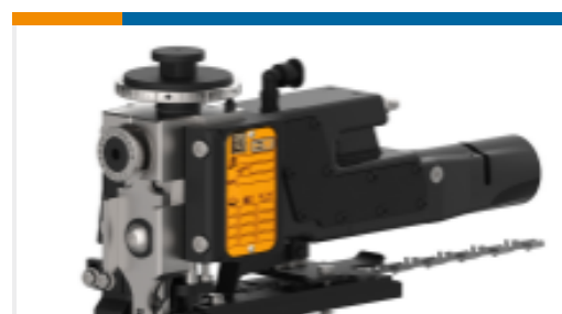
TE 产品编号 2150677-2 OCEAN_2.0_APPLICATOR-E-100F-REA