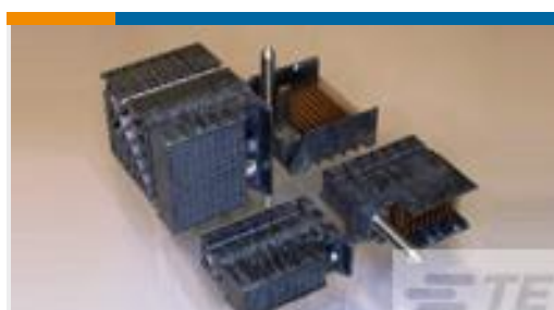
TE 产品编号 2007838-2 IMP100S,H,V4P16C,JG,DEW39,4.9