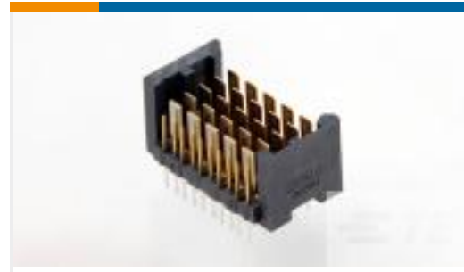
TE 产品编号5120874-1 HS3 10 ROW RECEPTACLE ASSY W/M