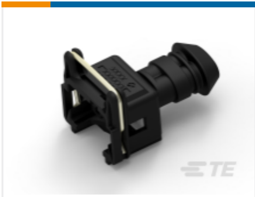
TE 产品编号1703727-1 2POS,JPT,HOUSING,ASSY,BK