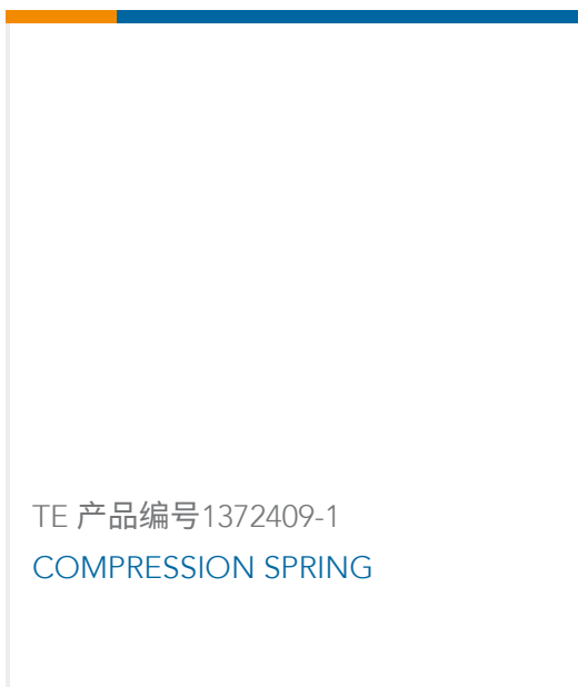
TE 产品编号1372409-1 COMPRESSION SPRING