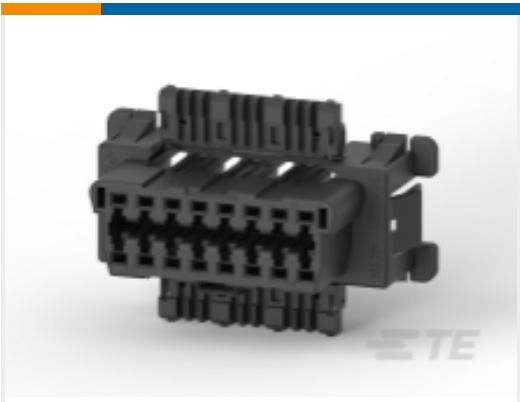
TE 产品编号348822-2 16 WAY DIAGNOSTIC CONN BLACK