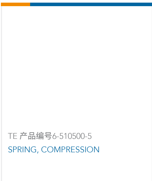
TE 产品编号6-510500-5 SPRING, COMPRESSION