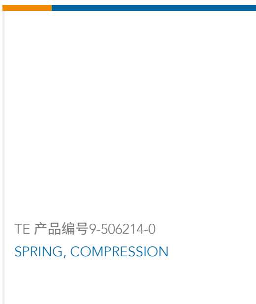
TE 产品编号9-506214-0 SPRING, COMPRESSION