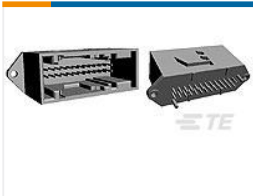
TE 产品编号185226-2 26pos MQS .63 header 180deg