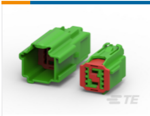
TE 产品编号1-1419158-7 GET .64 连接器系统 · 连接器壳体