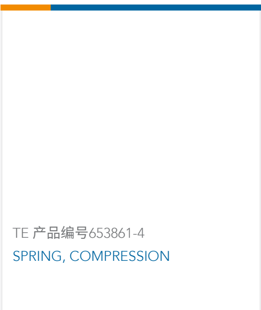
TE 产品编号653861-4 SPRING, COMPRESSION