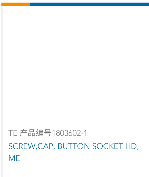
TE 产品编号1803602-1 SCREW,CAP, BUTTON SOCKET HD, ME