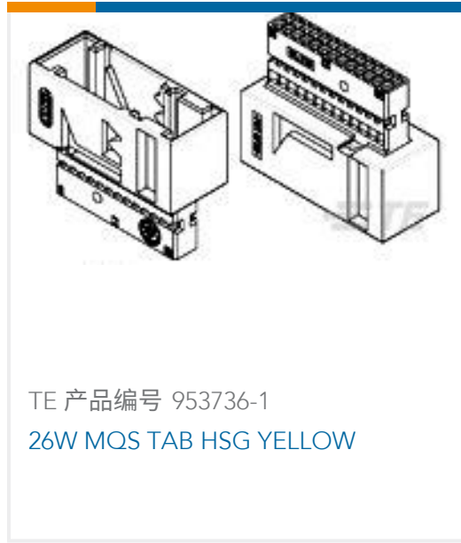
TE 产品编号 953736-1 26W MQS TAB HSG YELLOW