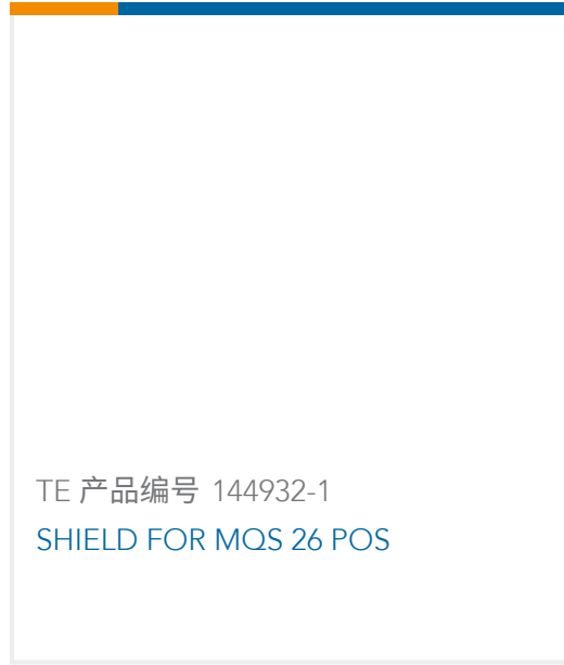
TE 产品编号 144932-1 SHIELD FOR MQS 26 POS