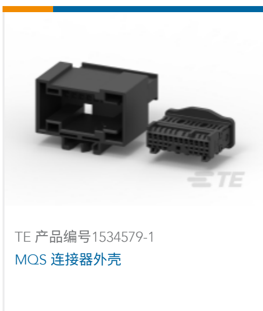
TE 产品编号1534579-1 MQS 连接器外壳