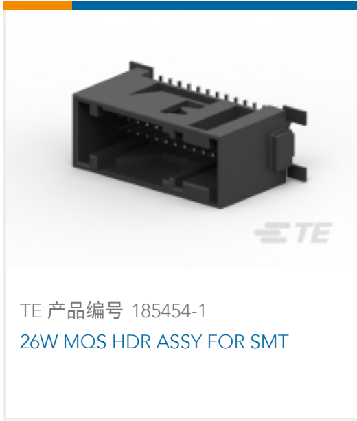
TE 产品编号 185454-1 26W MQS HDR ASSY FOR SMT