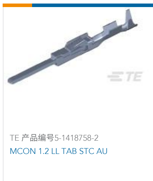
TE 产品编号5-1418758-2 MCON 1.2 LL TAB STC AU