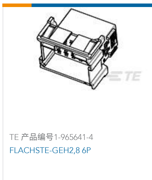
TE 产品编号1-965641-4 FLACHSTE-GEH2,8 6P