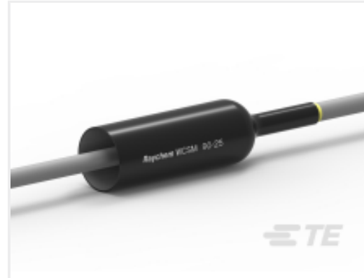
TE 产品编号 CU4604-000 WCSM-90/25-500/S(S5)