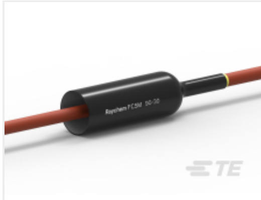
TE 产品编号 D19061-000 FCSM-90/30-1500/S(S5)