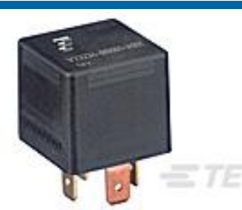
TE 产品编号3-1904022-2 V23234A1001X036-EV-100