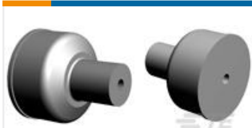
TE 产品编号347707-1 0.5MM CABLE SEAL HC SILIC