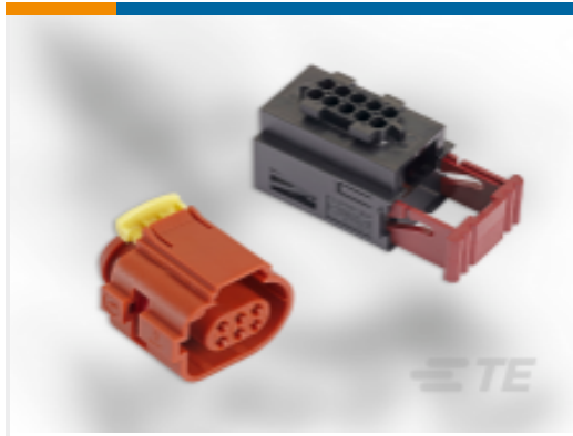
TE 产品编号2-963207-1 Timer Connector Housing