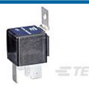
TE 产品编号1393304-5 V23134J0056X408-EV-CBOX