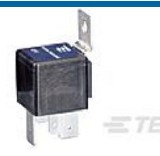
TE 产品编号9-1393303-7 V23134J0053D642-EV-CBOX