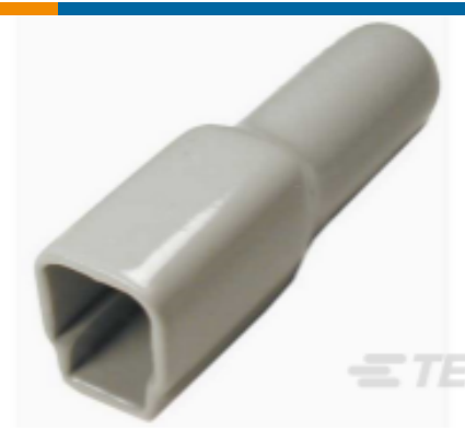
TE 产品编号DT2S-BT BOOT, 2P, PLG, ST, GRY