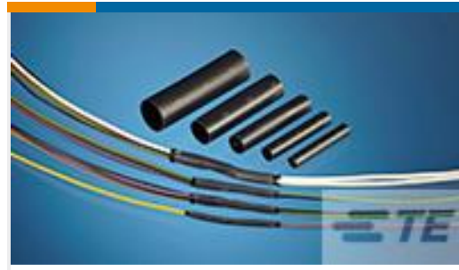
TE 产品编号CH02926001 QSZH-125-NR1-50MM