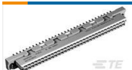
TE 产品编号1-1393641-4 V42254B2202B640=PC612 FEDERLEI