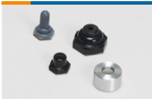
开关密封件和附件(8)