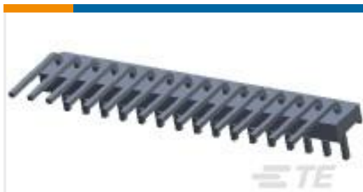
TE 产品编号1-640453-6 16P MTA100 HDR ASSY SQ R/A