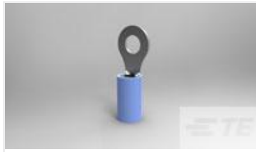
TE 产品编号320565 TERMINAL,PIDG R 16-14 8