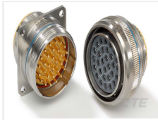
TE 产品编号ZPF000000000007867 983-0YE 14-07 PN