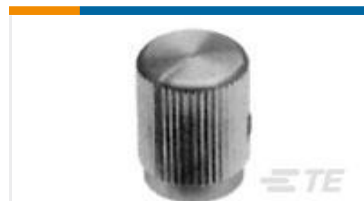
TE 产品编号9-1437621-9 KLN500B1/8=KNOB KNURL W/IND LI