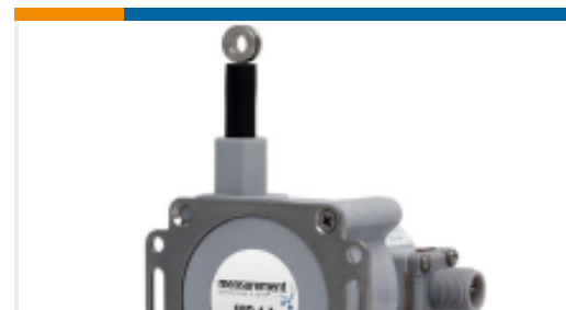
TE 产品编号SP3-25 紧凑型拉绳位移传感器，用户选择输出