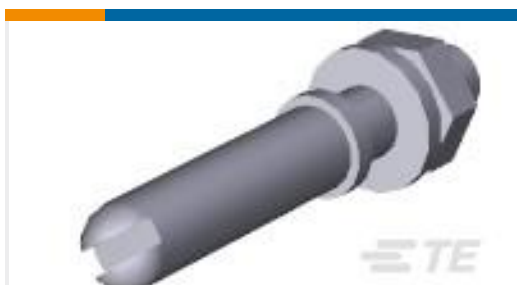
TE 产品编号200389-2 GUIDE PIN KIT