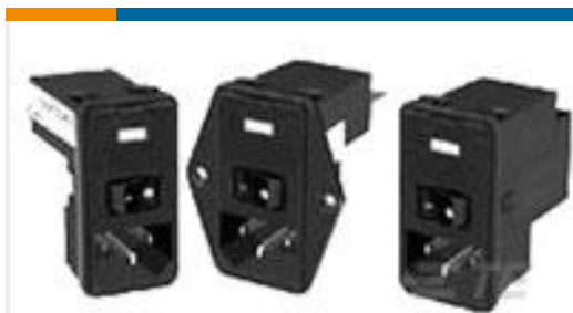
TE 产品编号6609107-2 PS0SXD560=C1027