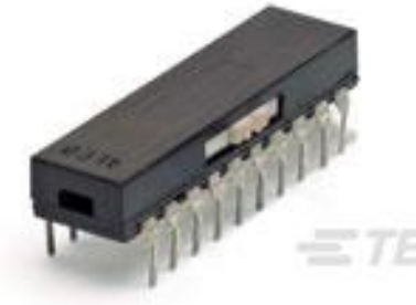
TE 产品编号6-1825011-4 ASF62RG04=6PDT AUTOSLIDE