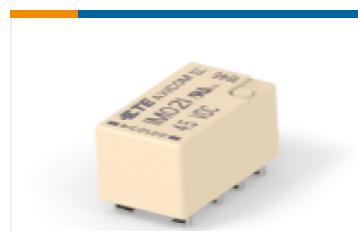
TE 产品编号1462047-8 IM02JIR=IM RELAY 140mW 4.5V HCV