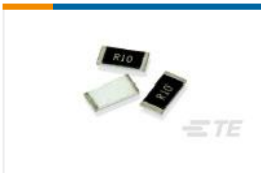
TE 产品编号2-2176057-7 RLP73K 3A R12 1% 1K RL