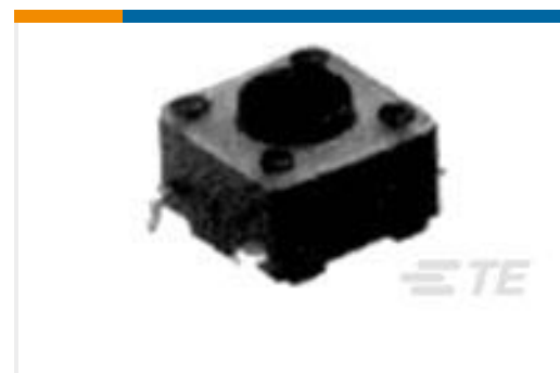
TE 产品编号3-1437565-0 FSM2JSMATR=ON T/R