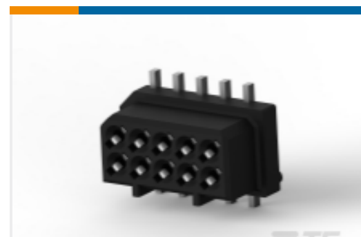
TE 产品编号4-175638-0 1.25FP,R10,DL,B,N,TR