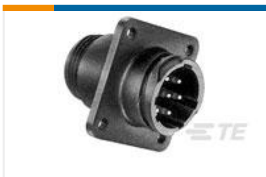
TE 产品编号211401-2 RECEPT,SZ 13-7,CPC