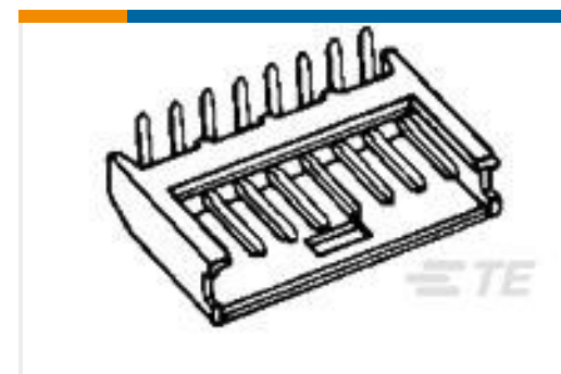
TE 产品编号280378-1 4P AMPMODU II SHRD HDR, RT ANG, TIN