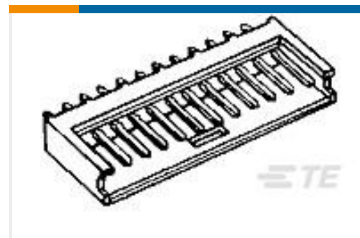
TE 产品编号280508-2 9P AMPMODU II SHRD HDR, ST, 0.38 AU