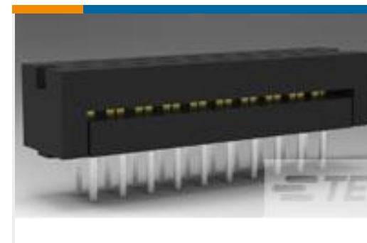
TE 产品编号1-746610-5 20 DIP PLUG, 100CL, LEAD FREE