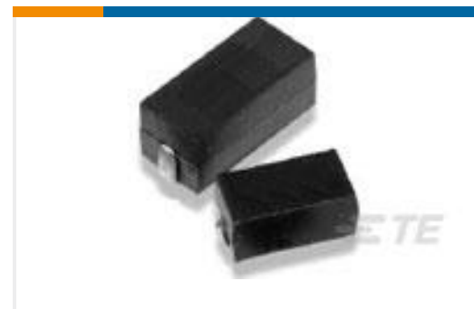
TE 产品编号1-1879011-5 SMF2 820R 5%