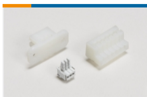
卡边缘连接器壳体(4)