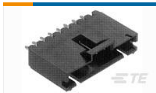
TE 产品编号5-103908-6 07 MTE HDR SRST LATCH W/HLDWN