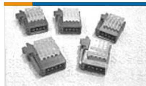
TE 产品编号4-1473562-4 RITS CONN. PLUG ASSY 4P GREEN