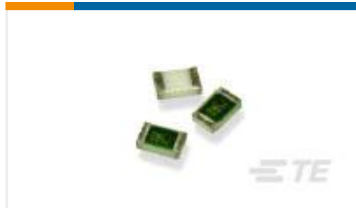
TE 产品编号6-1879208-9 CPF 0402 6K8 0.1% 25PPM 1K RL