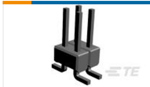
TE 产品编号1241050-2 2x2P MOD II BREAK AWAY HDR,SMD, BLISTER