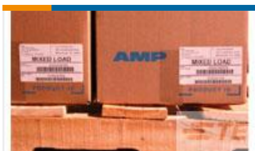
TE 产品编号D91406-000 EP-699254-5-9