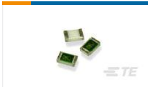
TE 产品编号8-1879215-6 CPF 0402 35K7 0.1% 25PPM 1K RL