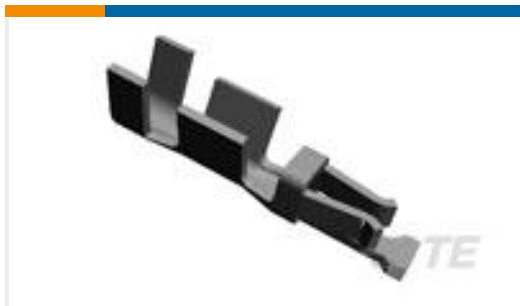
TE 产品编号969047-3 MODU CRIMP CONTACT