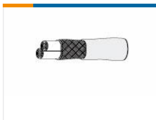
TE 产品编号272103-000 55A1123-20-9/96-9CS2275