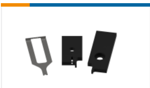
TE 产品编号1490525-3 DEPRESSOR, WIRE