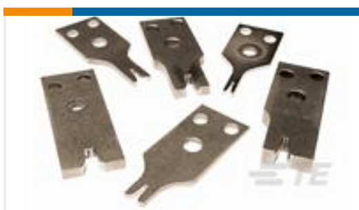
TE 产品编号5-456403-0 CRIMPER, WIRE .062F