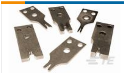
TE 产品编号1-1752057-4 CRIMPER, WIRE, STEPPED (.062)