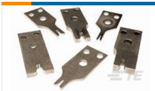
TE 产品编号2-456410-9 CRIMPER, WIRE .130 F