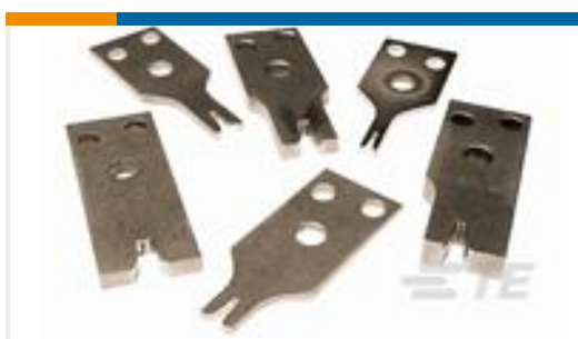
TE 产品编号2-2119784-6 CRIMPER, INSUL O PREMIUM