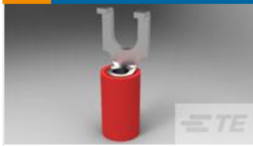
TE 产品编号32498 PIDG SPDFLG 22-16COM22-18MIL 8