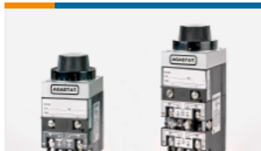
TE 产品编号1423158-7 7012L8ALLN=RLY,NAV,ON,2P,115VA