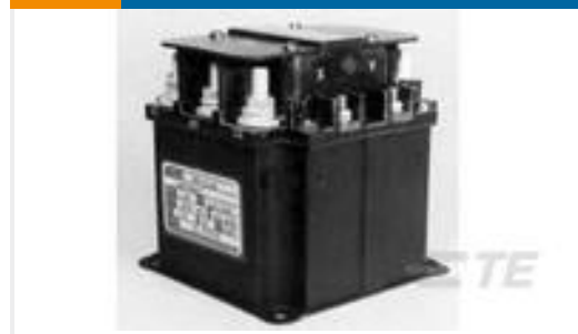
TE 产品编号1616004-5 B312CV=RELAY