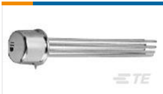
TE 产品编号1617167-6 JMSCDD-26XP = M39016/21-038P