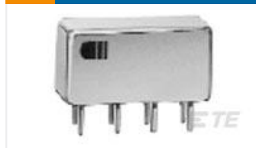
TE 产品编号2-1617038-2 HMB1201K01P = M39016/22-009P