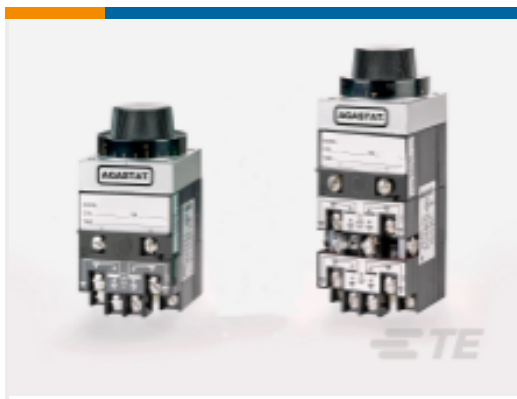
TE 产品编号 1423168-7 E7012AE004=RLY,NUC,ON,2P, 120VAC,200 SEC