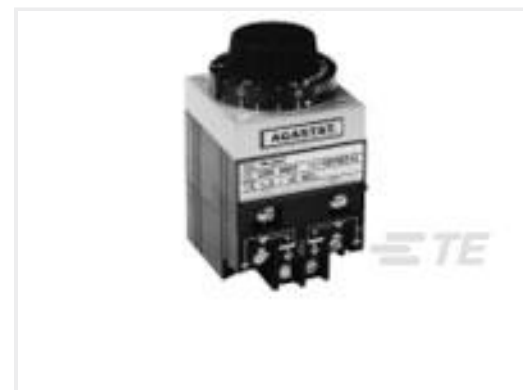
TE 产品编号1423171-7 E7022PD004=RLY,NUC,OFF,2P,125