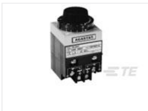
TE 产品编号1423173-5 E7014PE004=RLY,NUC,ON,4P,125V