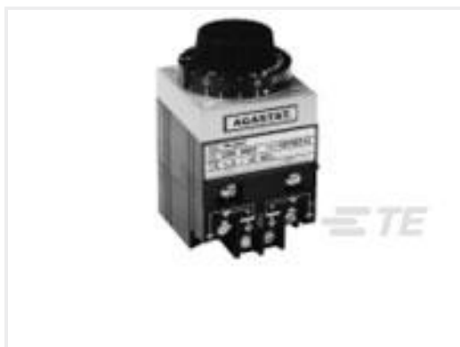
TE 产品编号1423171-5 E7022PC004=RLY,NUC,OFF,2P,125