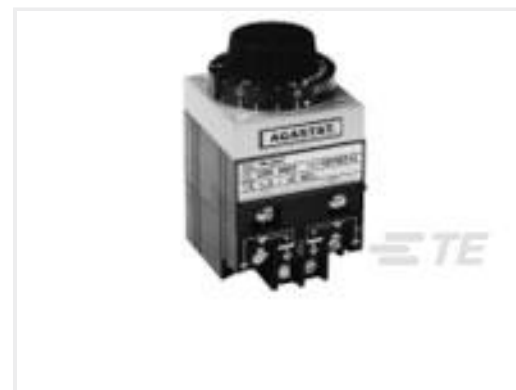
TE 产品编号1-1423169-2 E7012PE004=RLY,NUC,ON,2P,125V