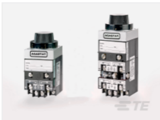
TE 产品编号1423168-4 E7012ABLL004=RLY,NUC,ON,2P,120V,5S,LL