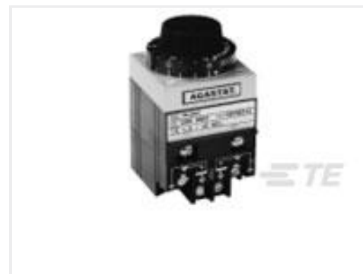
TE 产品编号1423173-3 E7014PC004=RLY,NUC,ON,4P,125V