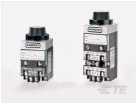
TE 产品编号 1423168-5 E7012AC004=RLY,NUC,ON,2P,120V