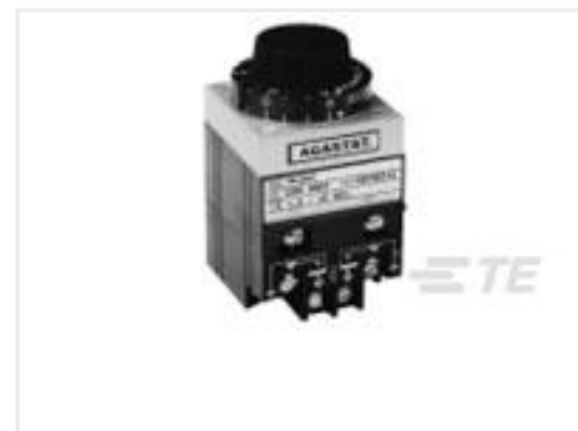
TE 产品编号1423169-6 E7012PB004=RLY,NUC,ON,2P,125V