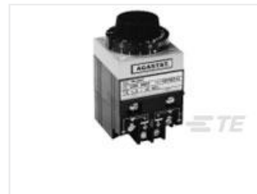
TE 产品编号1423171-3 E7022PB004=RLY,NUC,OFF,2P,125