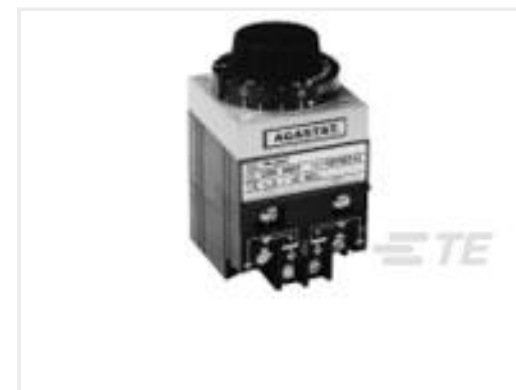
TE 产品编号1423173-4 E7014PD004=RLY,NUC,ON,4P,125V