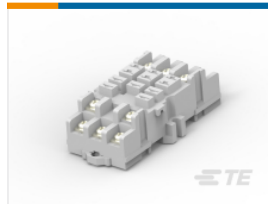
TE 产品编号2-1419106-5 27E893=SOCKET,KU,11,QC,POLY,NA-