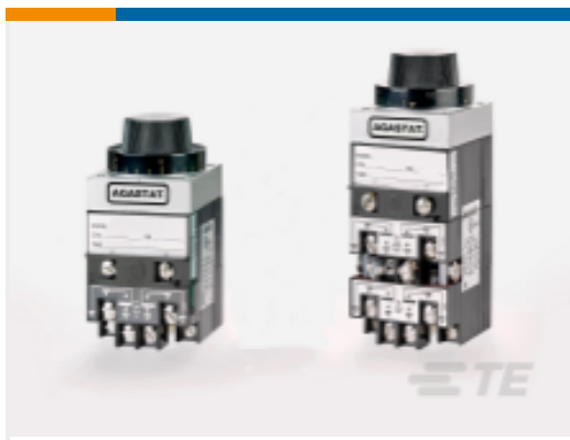
TE 产品编号 1423157-5 7012AC=RLY,STD,ON,2P,120VAC,15