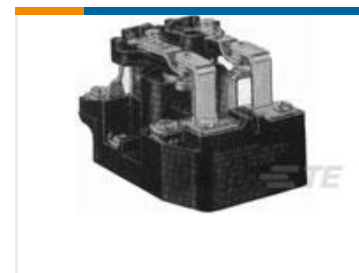
TE 产品编号2-1393127-6 PRD-11AY0-120=PRD