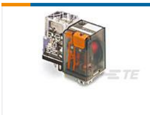
TE 产品编号3-1393104-6 KRPA-11AY-120=KRPA