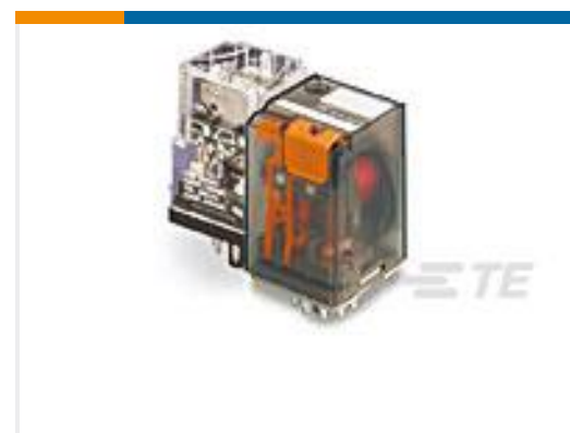
TE 产品编号4-1393104-4 KRPA-11DG-125=KRPA