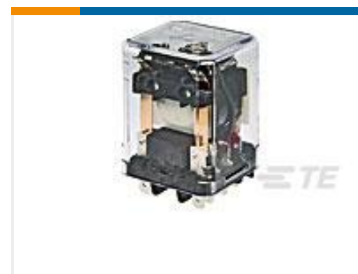
TE 产品编号4-2027183-3 KUEP-11D15-125=RELAY,3A,2C, AGCDO,OC.187,