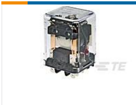
TE 产品编号1-1393114-1 KUEP-7D15-24=KU