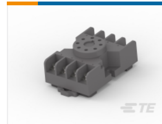
TE 产品编号2-1419106-3 27E891=SOCKET,KRPA,8,OCTAL,POL