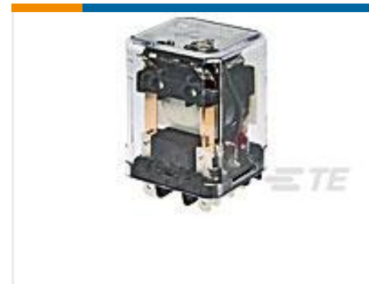
TE 产品编号8-1393113-7 KUEP-11D15-24=KU-