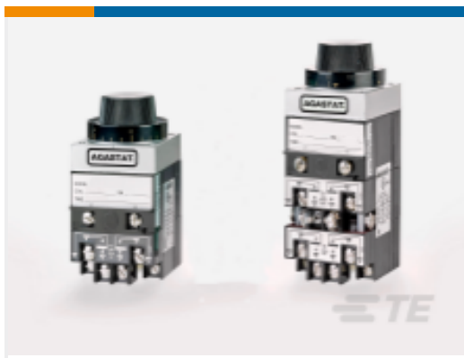
TE 产品编号 2-1423159-3 7012PC=RLY,STD,ON,2P,125VDC,15