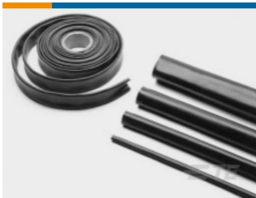
TE 产品编号CB5437-000 XFFR Heat Shrink Tubing