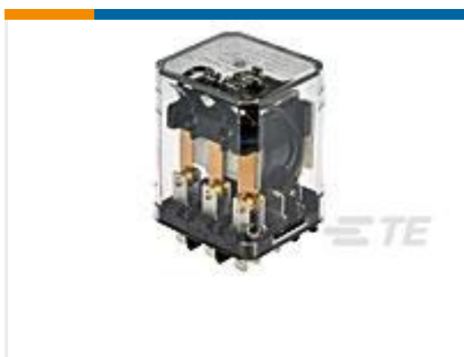
TE 产品编号5-1393117-9 KUP-11D55-48=KU