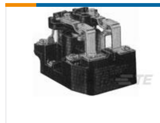
TE 产品编号3-1393127-1 PRD-11AY0-480=PRD