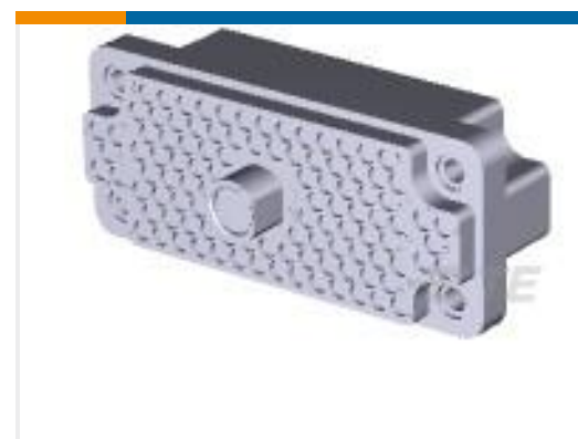
TE 产品编号201532-2 RECEPT BLOCK,104 POSN,M SERIES