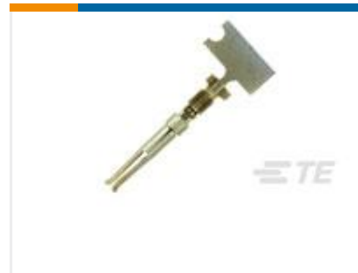
TE 产品编号66504-9 SOCKET CONTACT, 20 DF