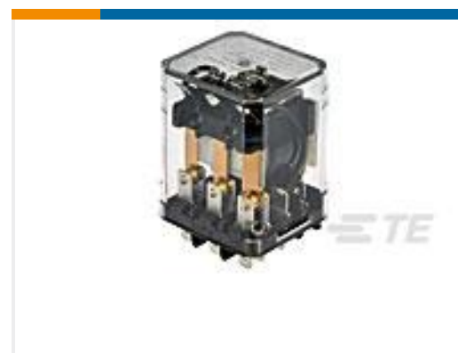
TE 产品编号5-1393117-8 KUP-11D55-24=KU