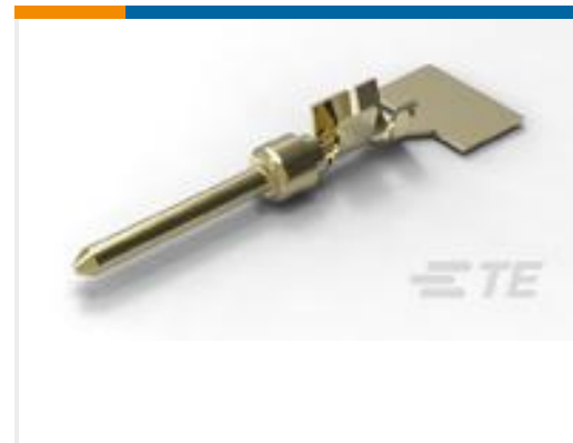
TE 产品编号66506-9 PIN CONTACT, 20 DF