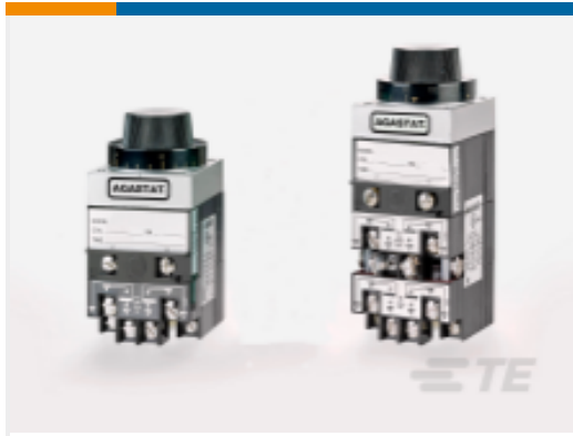
TE 产品编号 2-1423157-4 7012AK=RLY,STD,ON,2P,120VAC,30