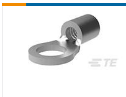
TE 产品编号2-33457-2 TERMINAL,SOLIS R 12-10 10