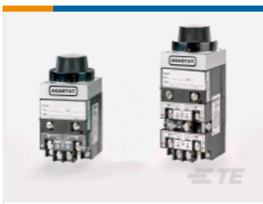
TE 产品编号 3-1423159-3 7012PJ=RLY,STD,ON,2P,125VDC,1