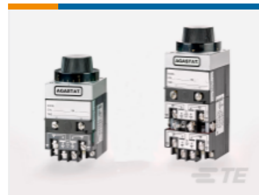
TE 产品编号 4-1423157-4 7012JC=RLY,STD,ON,2P,208VAC,1