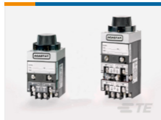
TE 产品编号 2-1423157-4 7012AK=RLY,STD,ON,2P,120VAC,30