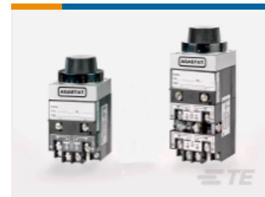
TE 产品编号 1423159-3 7012NC=RLY,STD,ON,2P,48VDC,15