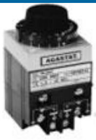
TE 产品编号3-1423159-3 7012PJ=RLY,STD,ON,2P,125VDC,1