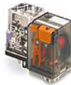
TE 产品编号6-1393104-5 KRPA-14AG-120=KRPA