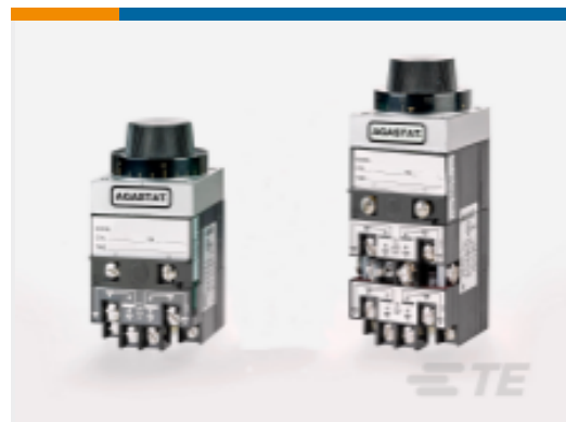
TE 产品编号 1423157-9 7012ADL=RLY,STD,ON,2P,120VAC,5