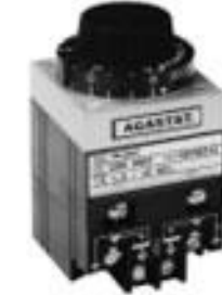
TE 产品编号1-1423157-5 7012AF=RLY,STD,ON,2P,120VAC,10