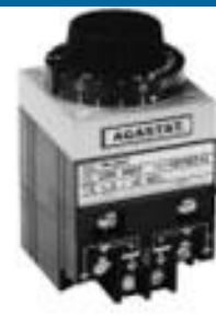
TE 产品编号2-1423162-8 7022BF=RLY,STD,OFF,2P,240VAC,