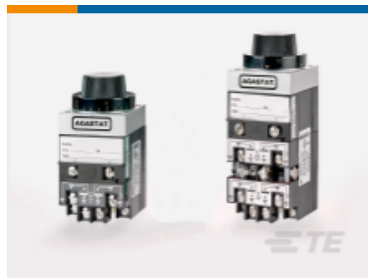
TE 产品编号 6-1472995-2 7012OBILM=RLY,STD,ON,2P,24V,5S,I, L,M