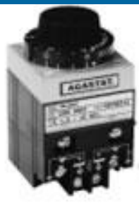
TE 产品编号1-1423162-0 7022AF=RLY,STD,OFF,2P,120VAC,1