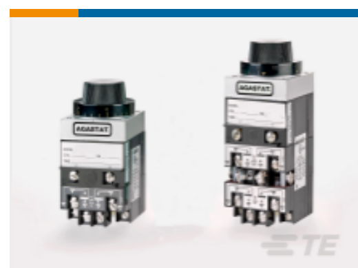
TE 产品编号 1-1423162-8 7022AK=RLY,STD,OFF,2P,120VAC,1