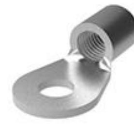
TE 产品编号35185 TERMINAL,SOLIS R 2 1/2