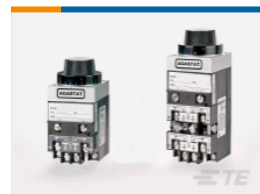
TE 产品编号 2-1423164-4 7022PDT=RLY,STD,OFF,2P,125VDC