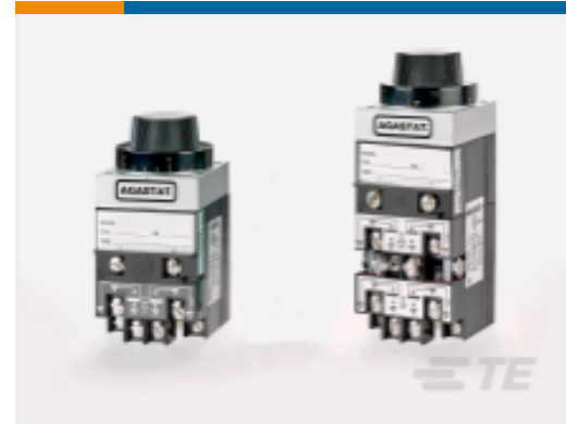
TE 产品编号 2-1472973-4 7012PILL=RLY,STD,ON,2P,125VDC, 60MIN,LL