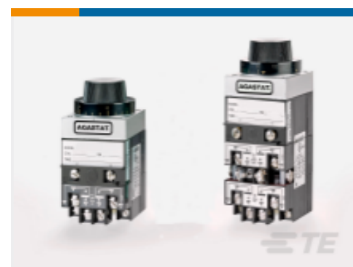
TE 产品编号 1423160-3 7014AC=RLY,STD,ON,4P,120VAC,20