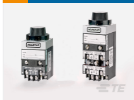
TE 产品编号 2-1437448-1 7012RC=RLY,STD,ON,2P,60 VDC,15