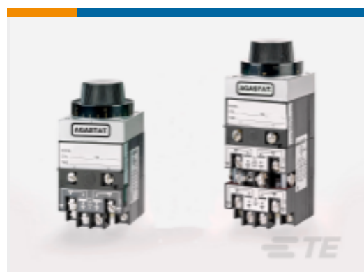
TE 产品编号 3-1423159-8 7012PJX=RLY,STD,ON,2P,125VDC,