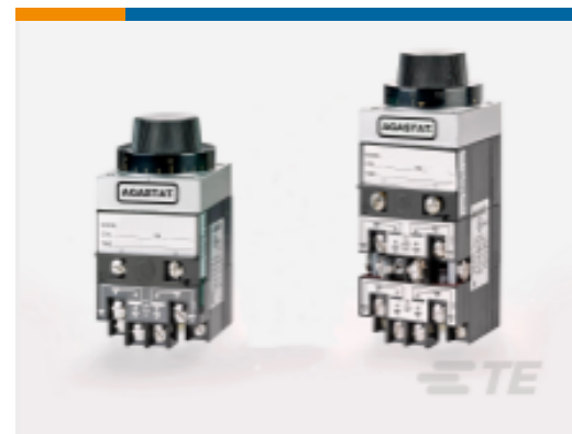
TE 产品编号 3-1472981-9 7022JB=RLY,STD,OFF,2P,208V,5S