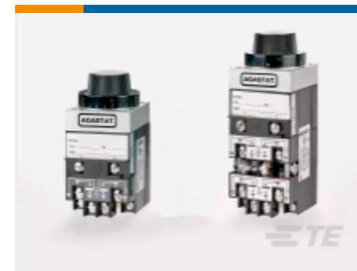
TE 产品编号 1-1472969-5 7022RCA2T=RLY,STD,OFF,2P,60VDC, 15SEC,A2,