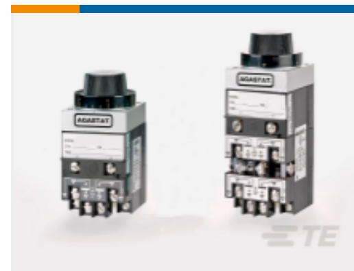
TE 产品编号 2-1423162-8 7022BF=RLY,STD,OFF,2P,240VAC,