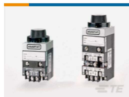
TE 产品编号 2-1423164-1 7022PCT=RLY,STD,OFF,2P,125VDC