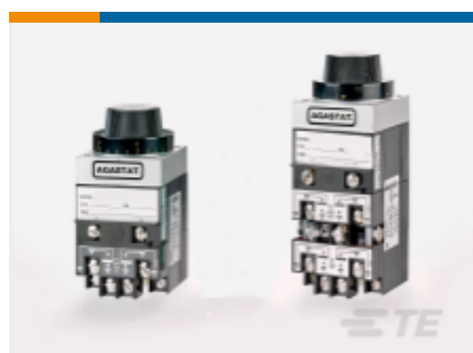
TE 产品编号 1423161-7 7014PC=RLY,STD,ON,4P,125VDC,20