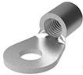
TE 产品编号33465 TERMINAL,SOLIS R 6 1/4