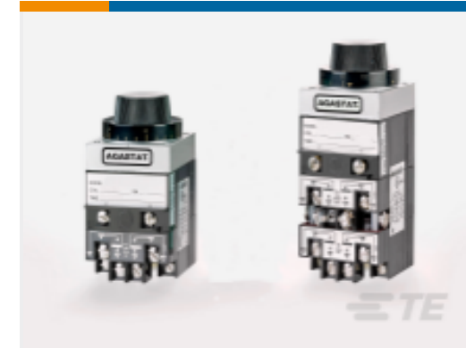
TE 产品编号 5-1423162-7 7022AET=RLY,STD,OFF,2P,120VAC,