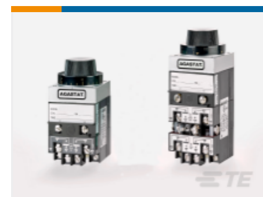
TE 产品编号 1423160-6 7014AF=RLY,STD,ON,4P,120VAC,1