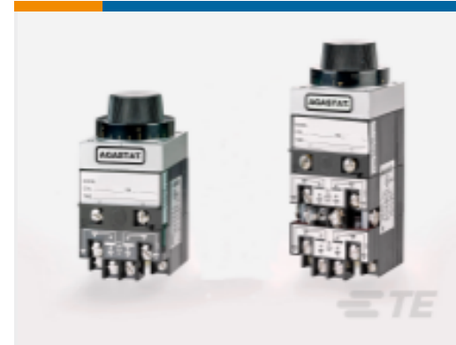
TE 产品编号 4-1423159-8 7012SB=RLY,STD,ON,2P,250VDC,5