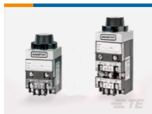
TE 产品编号 5-1423159-5 7012SJX=RLY,STD,ON,2P,250VDC,