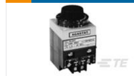
TE 产品编号1-1423159-0 7012NK=RLY,STD,ON,2P,48VDC,30