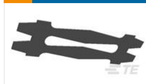
TE 产品编号192004-8 BAND STRIP LA1A(.006)SIL