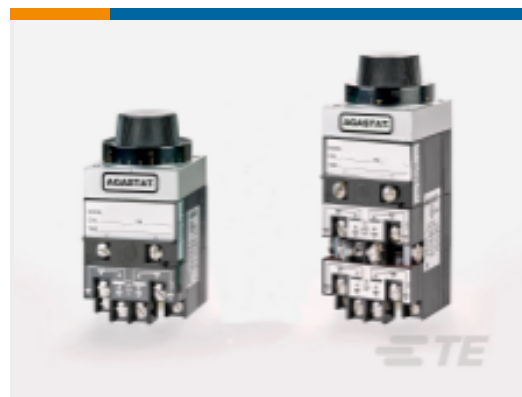
TE 产品编号 2-1423157-4 7012AK=RLY,STD,ON,2P,120VAC,30