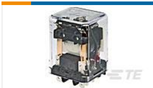
TE 产品编号4-2027183-3 KUEP-11D15-125=RELAY,3A,2C, AGCDO,QC.187,