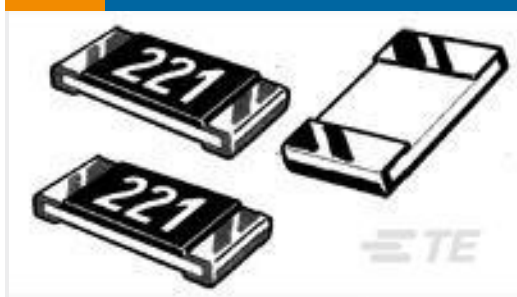
TE 产品编号8-2176070-5 3521 33K 1% 2W