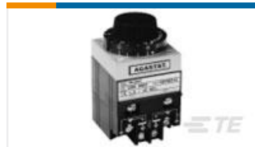
TE 产品编号1423164-4 7022NC=RLY,STD,OFF,2P,48VDC,1