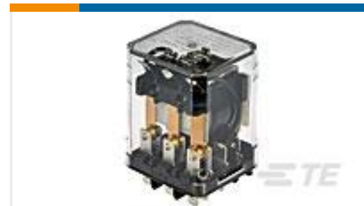
TE 产品编号4-1393117-2 KUP-11D11-24=KU