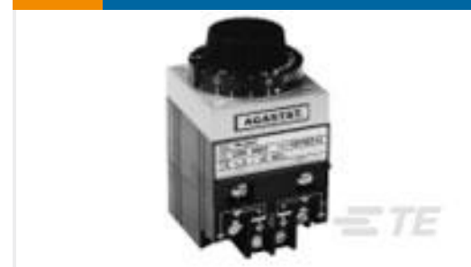
TE 产品编号2-1423159-3 7012PC=RLY,STD,ON,2P,125VDC,15