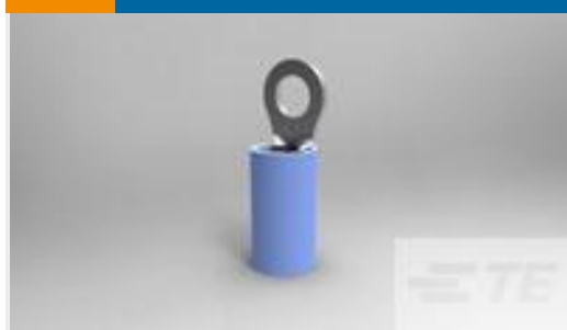
TE 产品编号50881-2 TERMINAL,PIDG R 16-14 6