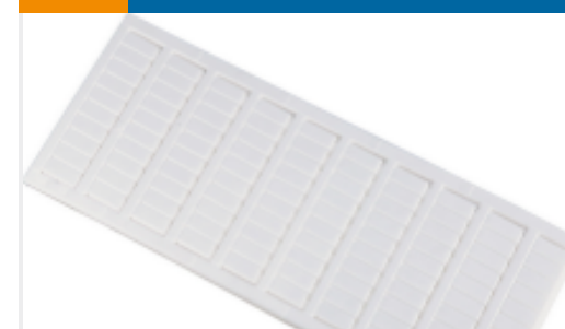
TE 产品编号1SNK150012R0000 MC612PA 1->10 (x10) Vertical