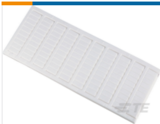
TE 产品编号1SNK150092R0000 MC612PA 0->9 (x10) Vertical