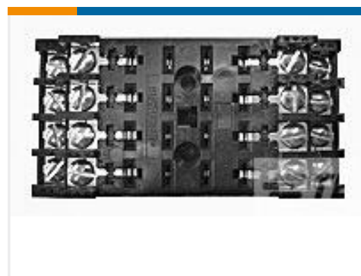
TE 产品编号1-1437436-0 CR0002=RLY SKT - 34121-01