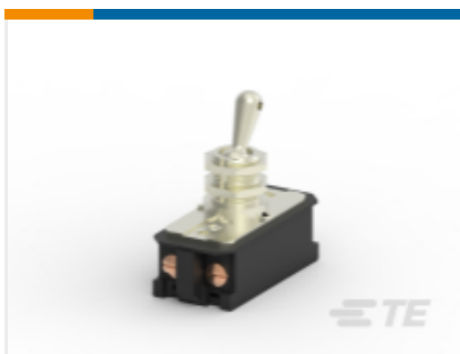
TE 产品编号1520237-2 7320K3=8 AMP TOGGLE SWITCH