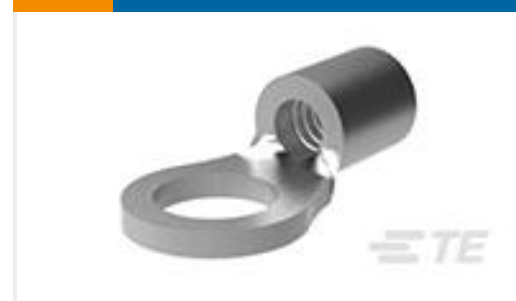
TE 产品编号2-324955-1 TERMINAL,SOLIS R 16-14 8