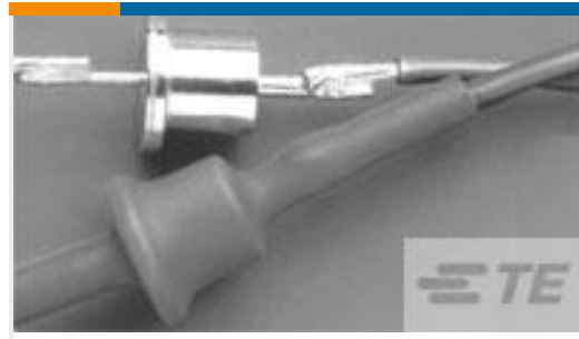
TE 产品编号5677822004 RNF-3000-39/13-6-STK