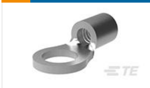
TE 产品编号2-34110-3 SOLIS R 22-16 COMM 22-18 MIL 6