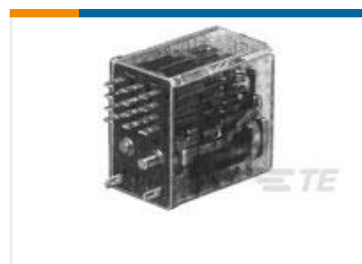
TE 产品编号 7-1393769-0 R10S-E1Y1-J1.0K=R10