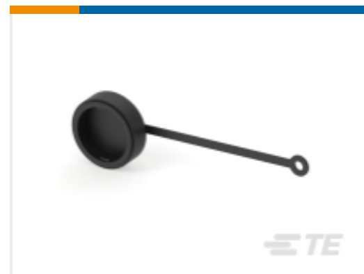
TE 产品编号 211870-2 SEALING CAP ASSY, SZ 13, CPC