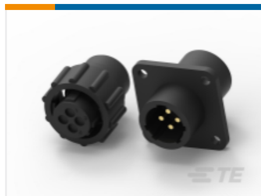
TE 产品编号 211771-1 Cable/Panel Mount Connector, CPC Series 1