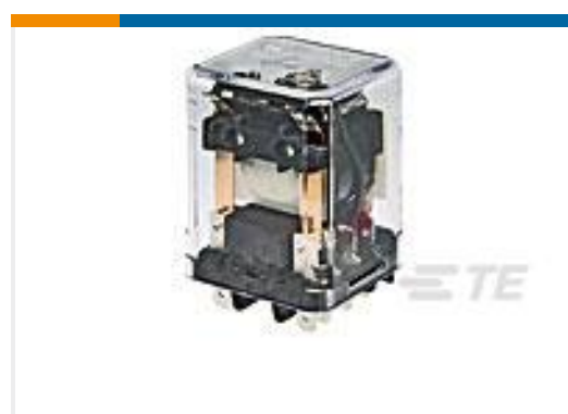
TE 产品编号 1-1393114-1 KUEP-7D15-24=KU