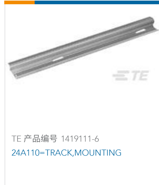
TE 产品编号 1419111-6 24A110=TRACK,MOUNTING