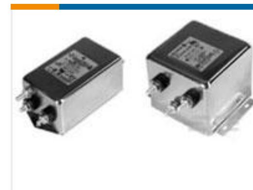
TE 产品编号 1-6609036-3 20VSK6=F7586 S0