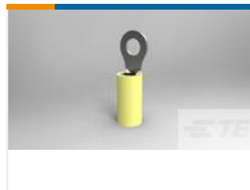
TE 产品编号 35109 TERMINAL, PIDG R 12-10 10