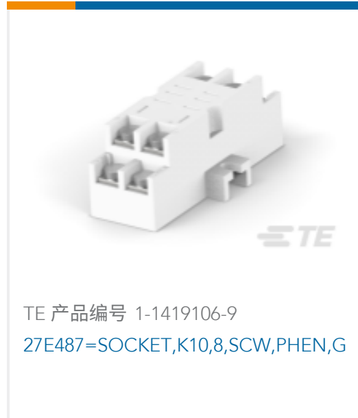
TE 产品编号 1-1419106-9 27E487=SOCKET,K10,8,SCW,PHEN,G