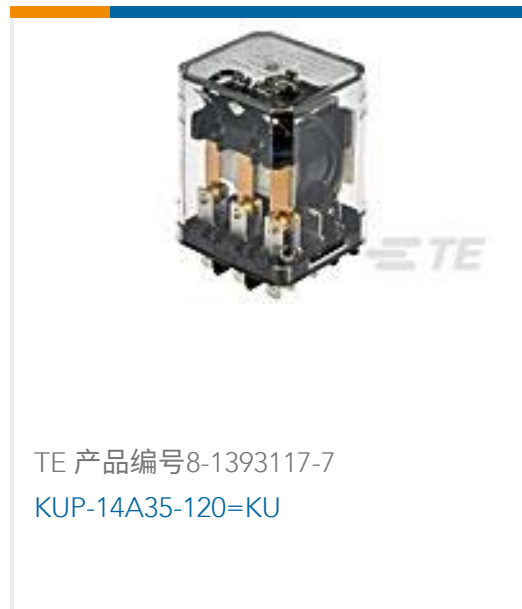
TE 产品编号8-1393117-7 KUP-14A35-120=KU