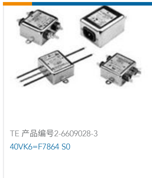
TE 产品编号2-6609028-3 40VK6=F7864 S0