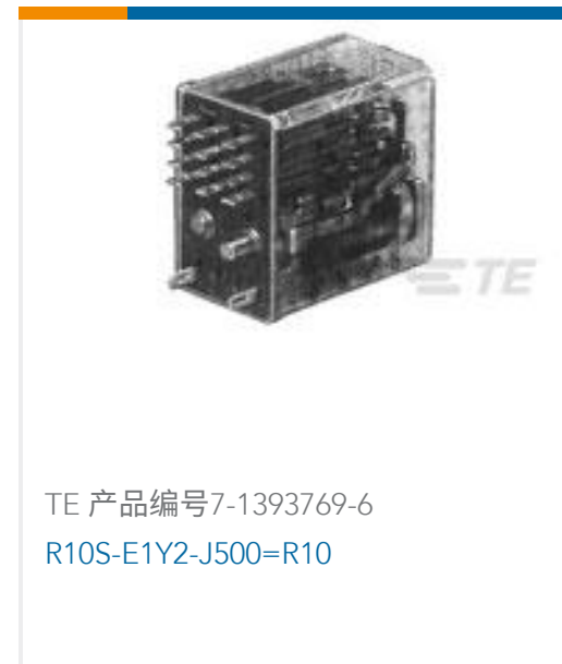
TE 产品编号7-1393769-6 R10S-E1Y2-J500=R10