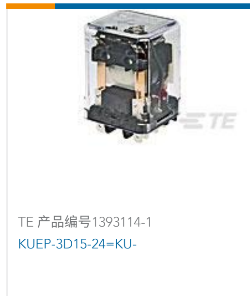
TE 产品编号1393114-1 KUEP-3D15-24=KU-