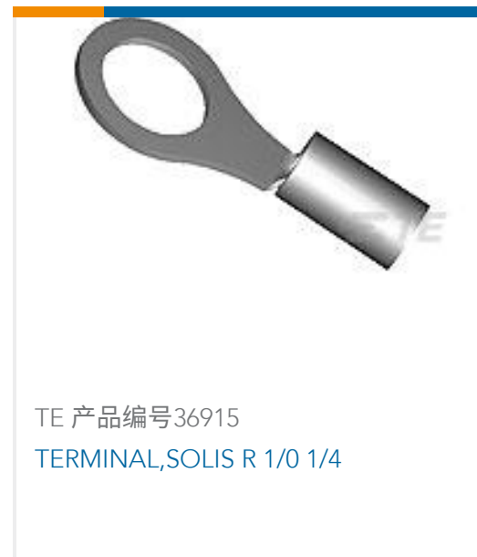
TE 产品编号36915 TERMINAL,SOLIS R 1/0 1/4