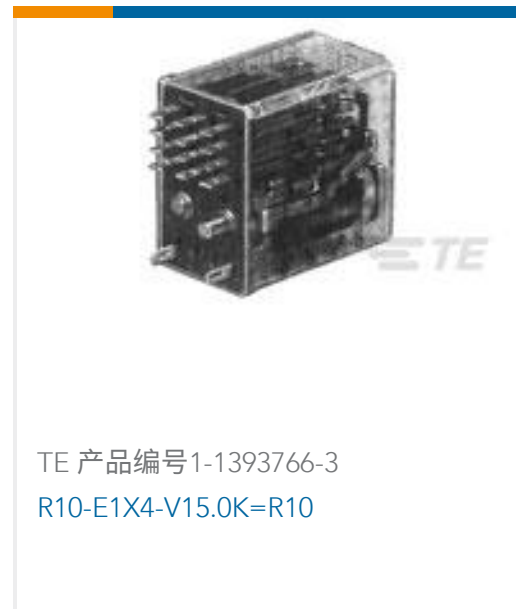
TE 产品编号1-1393766-3 R10-E1X4-V15.0K=R10