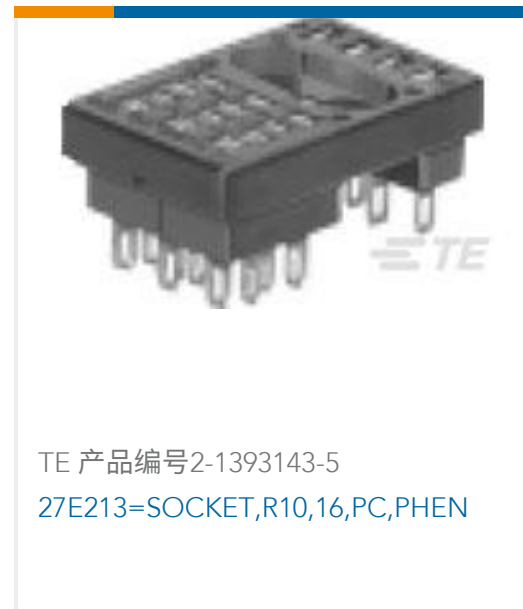
TE 产品编号2-1393143-5 27E213=SOCKET,R10,16,PC,PHEN