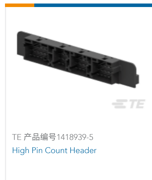
TE 产品编号 1418939-5 High Pin Count Header