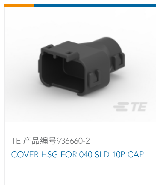
TE 产品编号 936660-2 COVER HSG FOR 040 SLD 10P CAP