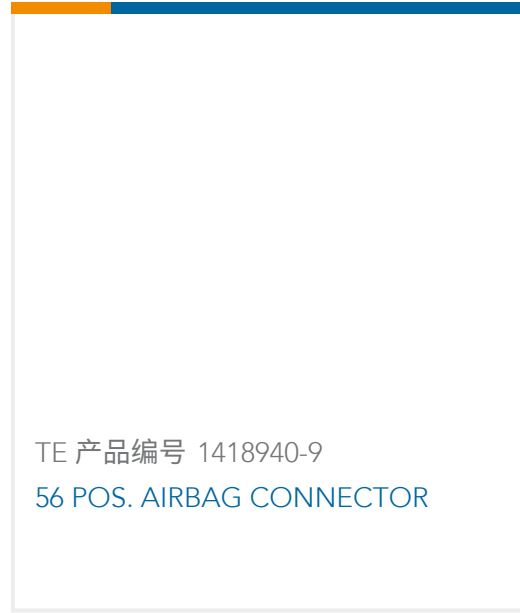
TE 产品编号 1418940-9 56 POS. AIRBAG CONNECTOR