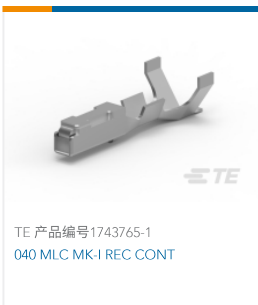
TE 产品编号 1743765-1 040 MLC MK-I REC CONT