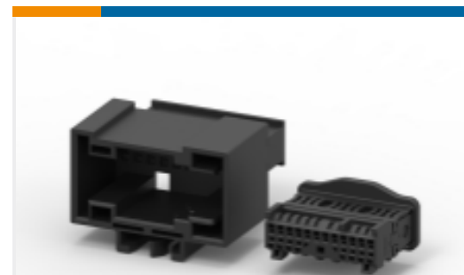
TE 产品编号1-968322-1 MOS 连接器外壳