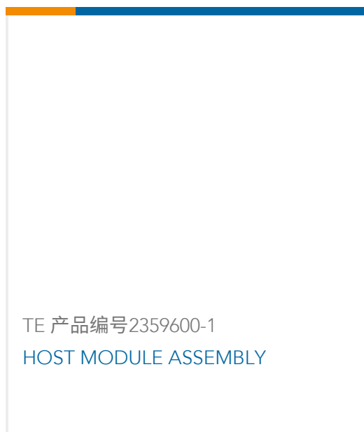
TE 产品编号2359600-1 HOST MODULE ASSEMBLY