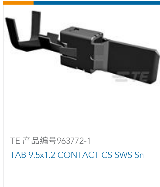
TE 产品编号963772-1 TAB 9.5x1.2 CONTACT CS SWS Sn