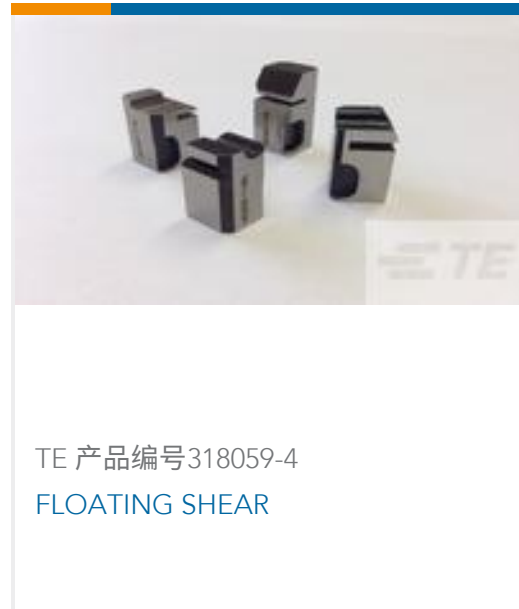
TE 产品编号318059-4 FLOATING SHEAR