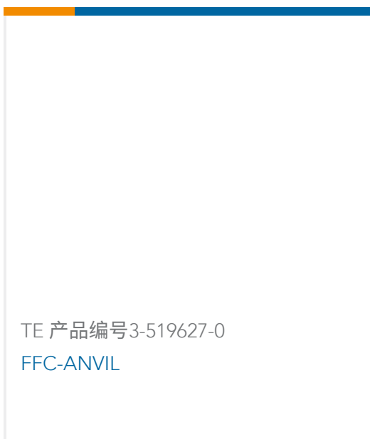
TE 产品编号3-519627-0 FFC-ANVIL