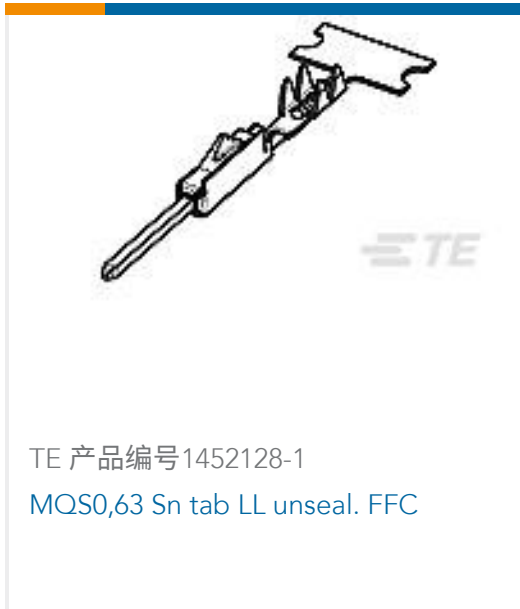
TE 产品编号1452128-1 MQS0,63 Sn tab LL unseal. FFC