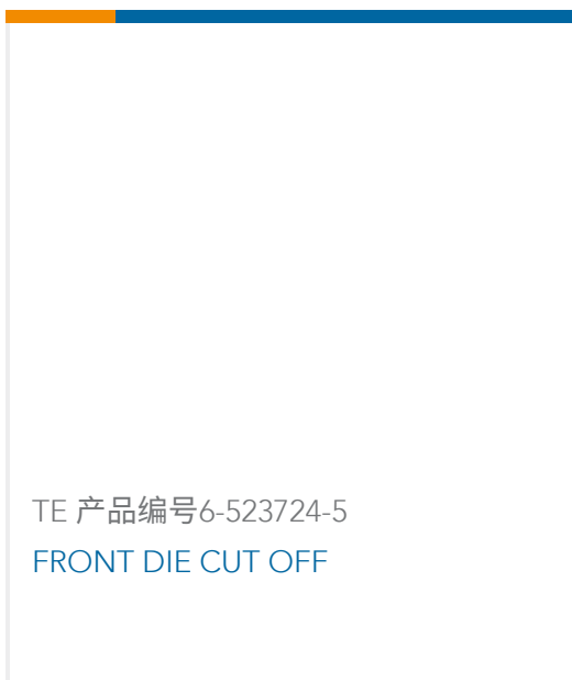
TE 产品编号6-523724-5 FRONT DIE CUT OFF