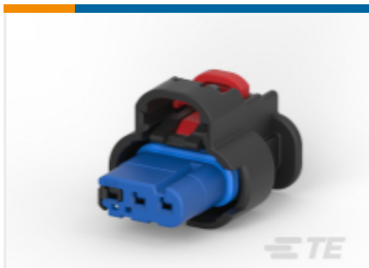
TE 产品编号 1-2203771-1 3POS, MCON 1.2 CB REC 1p TL SEALED