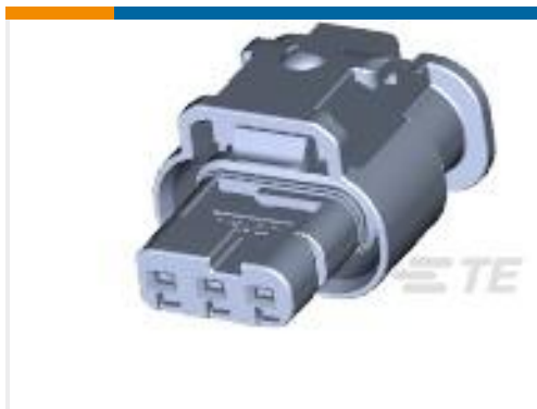
TE 产品编号 1488991-2 3POS, MCON 1.2 CB REC 2p TL SEALED