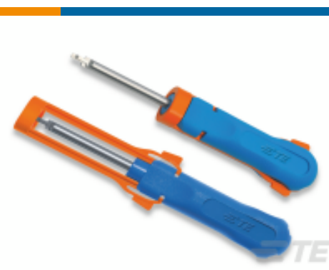
TE 产品编号 8-1579008-4 EXTRACTION TOOL