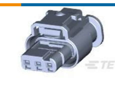
TE 产品编号 1488991-5 3POS, MCON 1.2 CB REC 2p TL SEALED