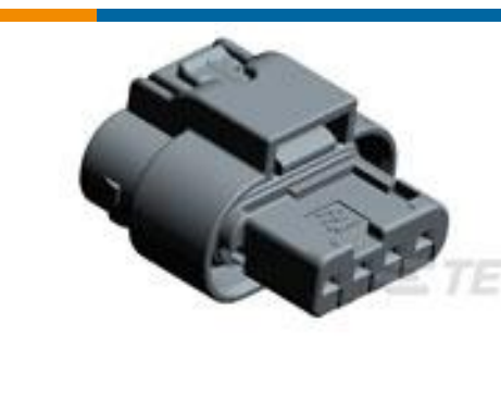
TE 产品编号 1-1456426-6 4POS, MCON 1.2 CB REC 2p TL SEALED