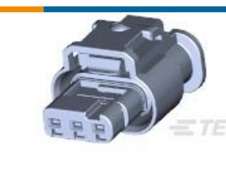
TE 产品编号 1488991-1 3POS, MCON 1.2 CB REC 2p TL SEALED