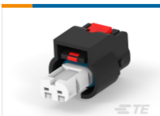
TE 产品编号 1-1924067-5 2POS, MCON 1.2 CB REC 2p TL SEALED