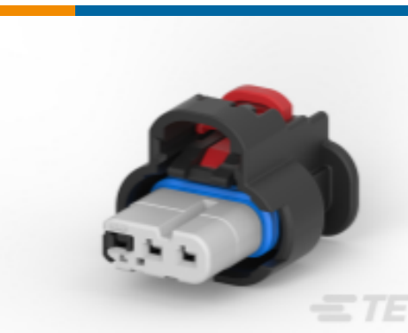
TE 产品编号 1-2203771-2 Plug Ass'y, 3P Sealed, Key B, CPA