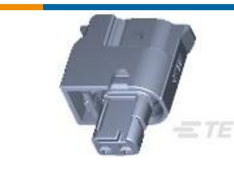
TE 产品编号 2098641-6 2POS, MCON 1.2 CB REC 2p SL SEALED