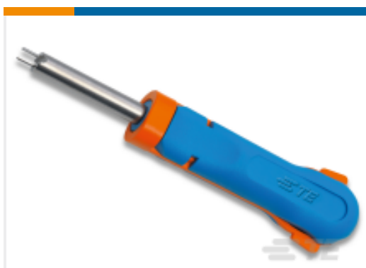
TE 产品编号 1-1579007-0 EXTRACTION TOOL