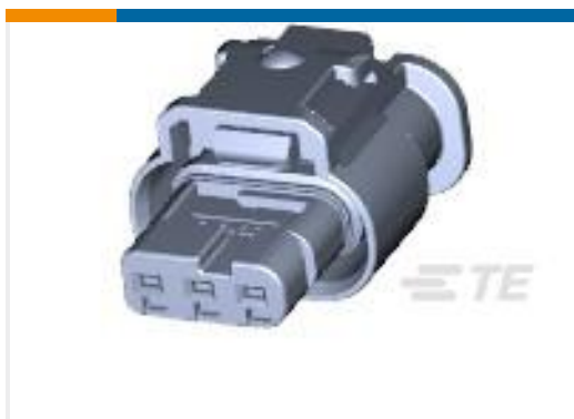
TE 产品编号 1488991-6 3POS, MCON 1.2 CB REC 2p TL SEALED