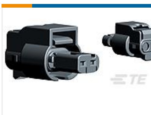
TE 产品编号 1-1924067-1 2POS, MCON 1.2 CB REC 2p TL SEALED