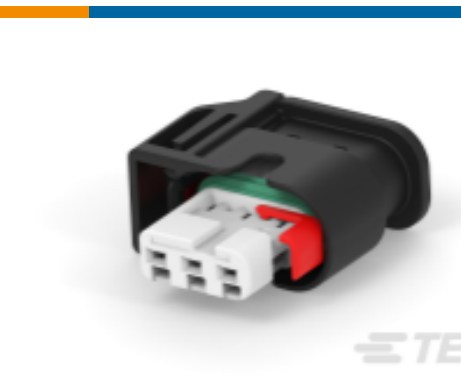
TE 产品编号 1488992-6 3POS, MCON 1.2 CB REC 2p SL SEALED