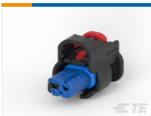
TE 产品编号 1-2203769-1 2POS, MCON 1.2 CB REC 1p TL SEALED