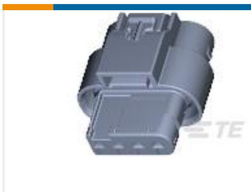
TE 产品编号 1-1456426-5 4POS, MCON 1.2 CB REC 2p TL SEALED