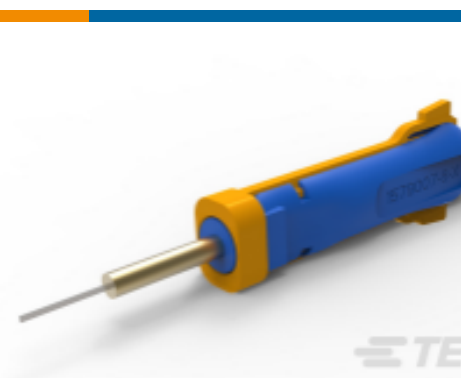
TE 产品编号 1579007-8 EXTRACTION TOOL