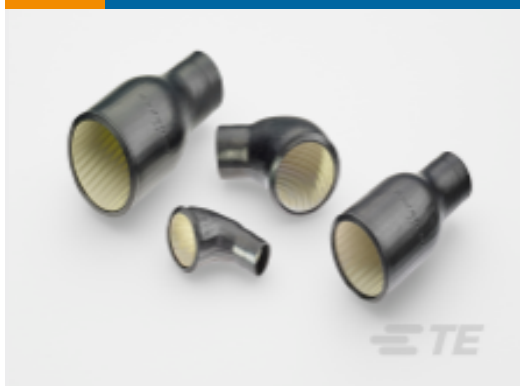
TE 产品编号EK7312-000 222S152-25C-0