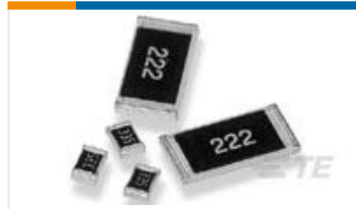
TE 产品编号1623131-1 CRG0805 1% 1K0