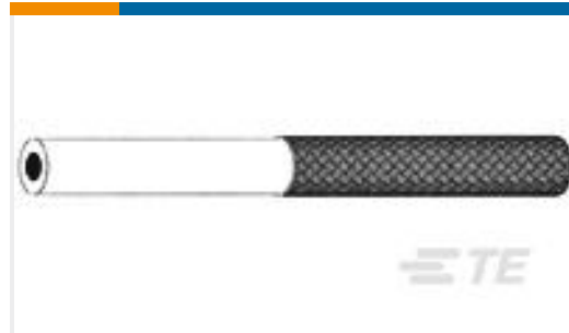
TE 产品编号C538733001 RAY-101-12.5(100)