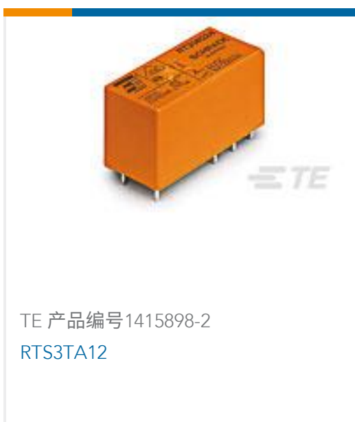
TE 产品编号1415898-2 RTS3TA12