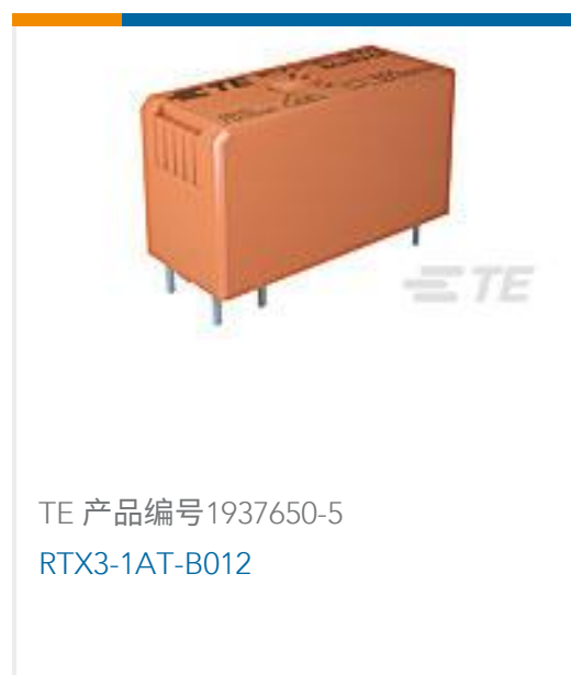
TE 产品编号1937650-5 RTX3-1AT-B012