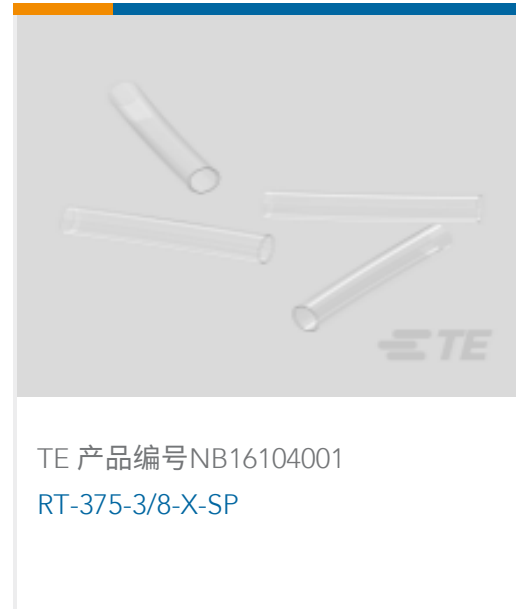
TE 产品编号NB16104001 RT-375-3/8-X-SP