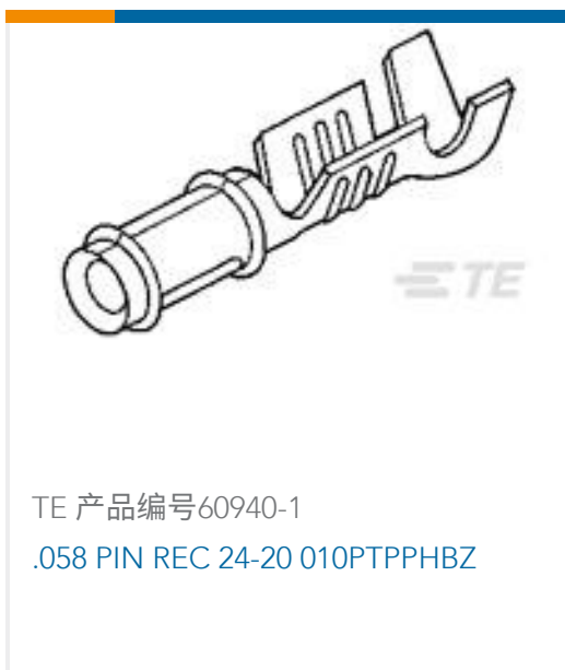
TE 产品编号60940-1 .058 PIN REC 24-20 010PTPPHBZ