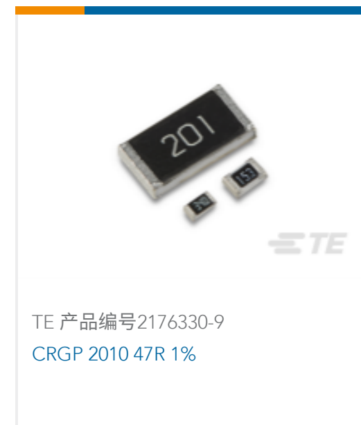
TE 产品编号2176330-9 CRGP 2010 47R 1%