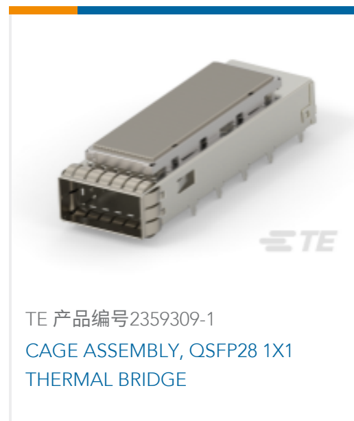
TE 产品编号2359309-1 CAGE ASSEMBLY, QSFP28 1X1 THERMAL BRIDGE