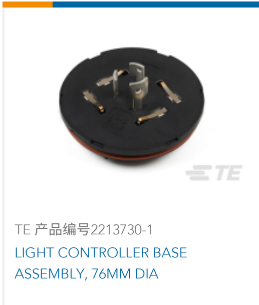
TE 产品编号2213730-1 LIGHT CONTROLLER BASE ASSEMBLY, 76MM DIA