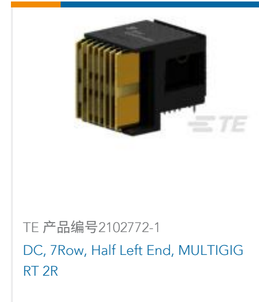
TE 产品编号2102772-1 DC, 7Row, Half Left End, MULTIGIG RT 2R