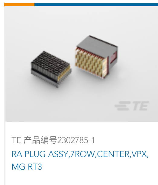
TE 产品编号2302785-1 RA PLUG ASSY,7ROW,CENTER,VPX, MG RT3