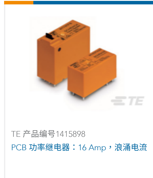
TE 产品编号1415898 PCB 功率继电器：16 Amp，浪涌电流