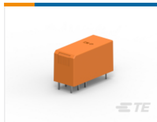
TE 产品编号4-2158000-2 RZ03-1A3-D012-R