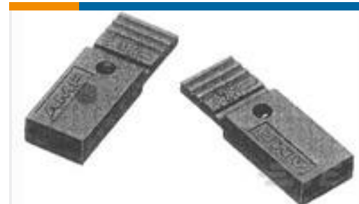
TE 产品编号2-881545-2 AMP SHUNT LOW PROFI