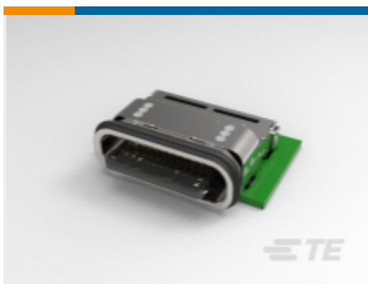
TE 产品编号2305018-2 USB TYPE C, REC IPX8 ON BOARD DUAL SMT