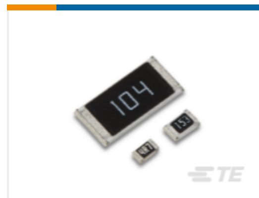
TE 产品编号5-2176337-4 CRGCO 0402 270K 1%