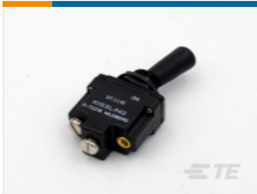
TE 产品编号K1007153 Toggle Switch 08-1-1-13