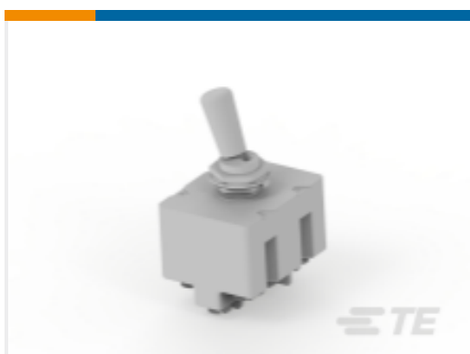
TE 产品编号K1002956 Toggle Switch 08-4-1-13