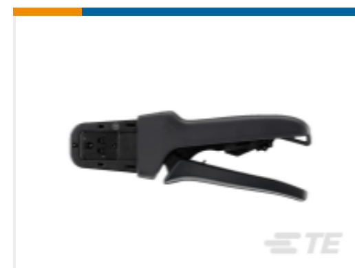
TE 产品编号DTT-20-03 CRIMP TOOL