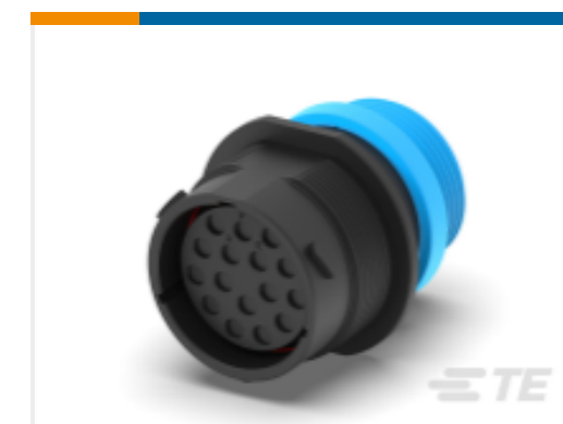
TE 产品编号HDP24-24-16SE-L015 REC, 16P, BLK, E, THD, 12, S