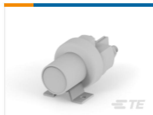
TE 产品编号K1008699 Relay 26-60-05