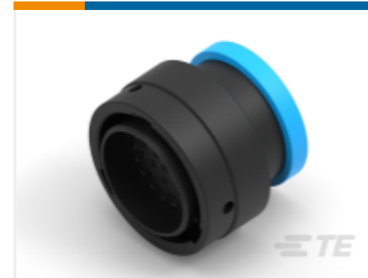
TE 产品编号YHDP26-24-35PEL017 PLG, 35P, BLK, E, RNG, 16/20, P