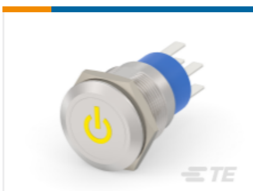
TE 产品编号6-2213766-9 AV19 DPL 5A POWER LED YELLOW 12V