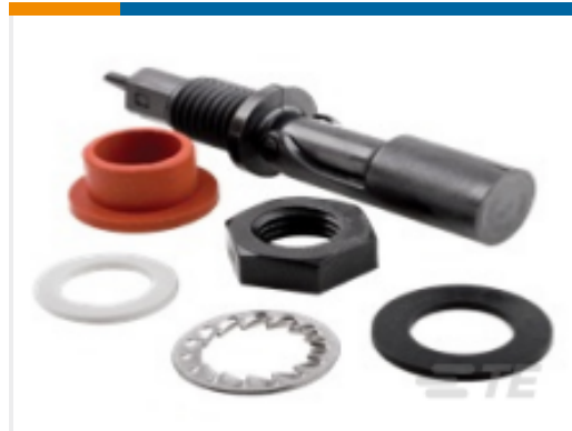
TE 产品编号80645-000 LS809-51 Liquid Level Sensor