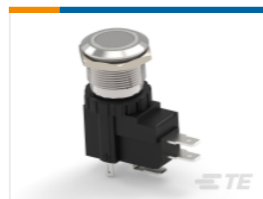
TE 产品编号2-2364570-8 AVH19 FLT SS LK RNG R&B 24V16A