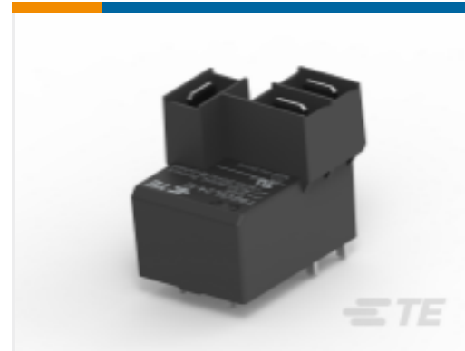
TE 产品编号1558676-6 T9GS1L24-22