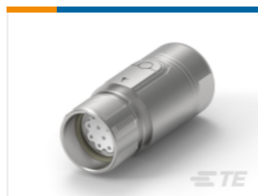
TE 产品编号AKA012N00410100000 623 EXTENSION, SPEEDTEC