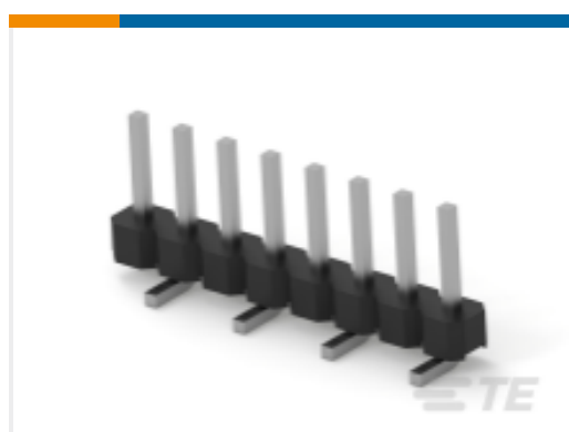
TE 产品编号2842104-8 8P, 2MM, BRK HDR, SRVT, SMD, 0.76AU, TR W/CAP