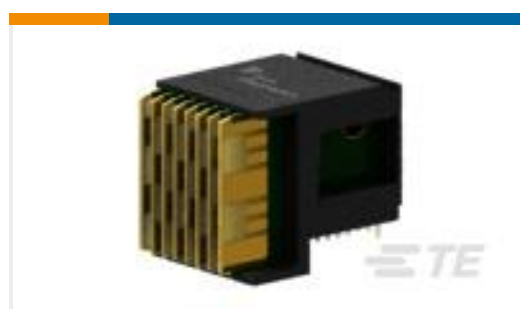
TE 产品编号 1410971-3 MULTIGIG RT T2 7RW H-LFT RTM