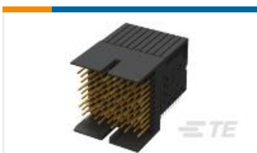
TE 产品编号 2102315-1 Fortis Zd 10 Col R/A Center Assy SE