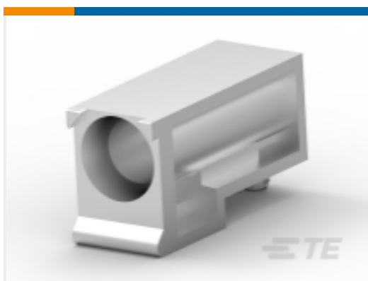
TE 产品编号 1-1469492-9 MULTIGIG RT 9MM GUIDE/ESD UNKE