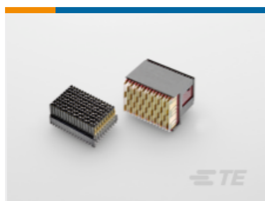
TE 产品编号2302792-1 VERTRECASSY,CENTER,SELLOAD, RTM,MGRT3