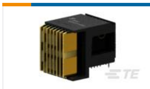
TE 产品编号 2102772-1 DC, 7Row, Half Left End, MULTIGIG RT 2R