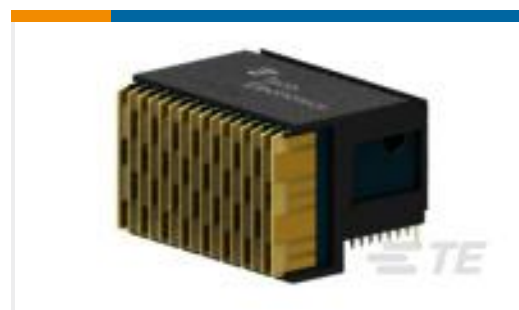
TE 产品编号 2102771-1 DC, 7Row, Center, MULTIGIG RT 2R