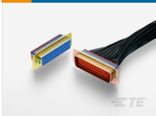
TE 产品编号2157481-4 AMPLIMITE IP67, SZ4, 109, 37 POS, RCPT