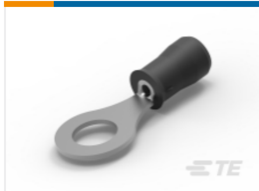
TE 产品编号35107 PIDG Ring Tongue Terminals