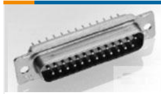
TE 产品编号204522-2 RECEPT ASSY,104 POSN,AMPLIMITE