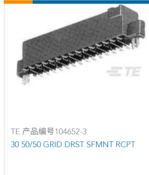
TE 产品编号104652-3 30 50/50 GRID DRST SFMNT RCPT