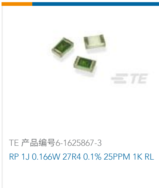
TE 产品编号6-1625867-3 RP 1J 0.166W 27R4 0.1% 25PPM 1K RL