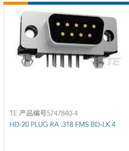
TE 产品编号5747840-4 HD-20 PLUG RA .318 FMS BD-LK 4