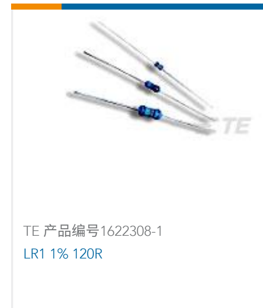
TE 产品编号1622308-1 LR1 1% 120R