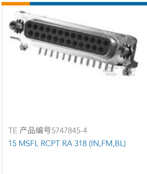
TE 产品编号5747845-4 15 MSFL RCPT RA 318 (IN,FM,BL)