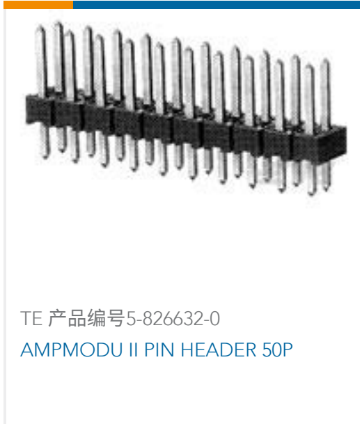
TE 产品编号5-826632-0 AMPMODU II PIN HEADER 50P