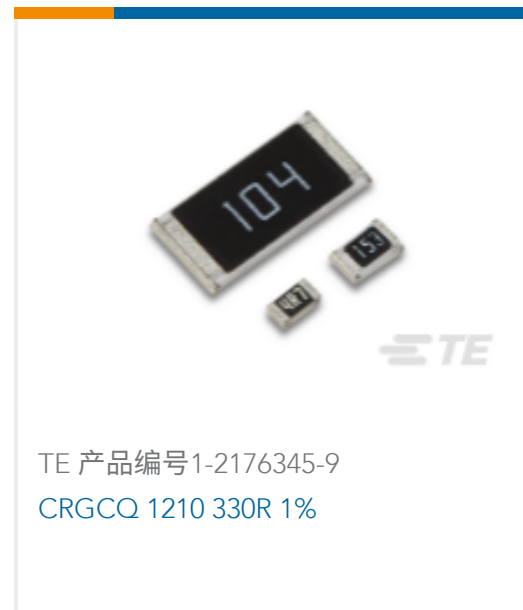
TE 产品编号1-2176345-9 CRGCQ 1210 330R 1%