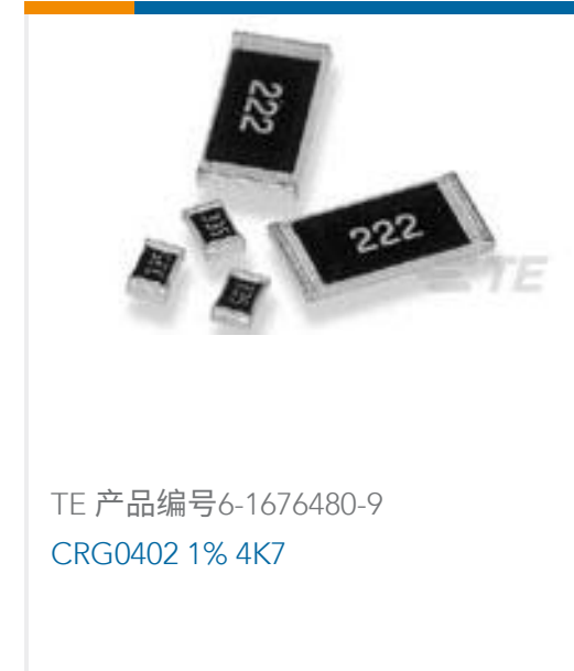
TE 产品编号6-1676480-9 CRG0402 1% 4K7