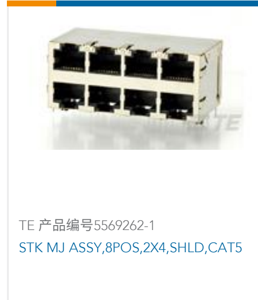
TE 产品编号5569262-1 STK MJ ASSY,8POS,2X4,SHLD,CAT5